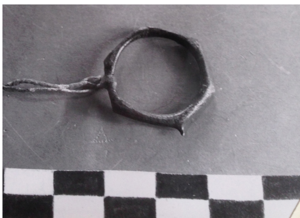
Slika 3. Obroček iz Štanjela (foto: P. Pavlin, hrani Pokrajinski muzej Ptuj – Ormož).

na Štanjel, skupaj z obravnavanim grobiščem. Domnevamo, da je Petru napačno sklepal o legi grobišča, za prstan pa je vedel, da je bil najden na območju Štanjela in ga zato tudi objavil v sklopu najdišča Štanjel. Predmet predstavlja šestkotni obroček z dvema izrazitima izrastkoma, kakršnega poznamo z Medejskega griča (Furlani 1974–1975, T. 4: 24), in sodi v stopnjo Sv. Lucija II c (Božič 2011, 246).