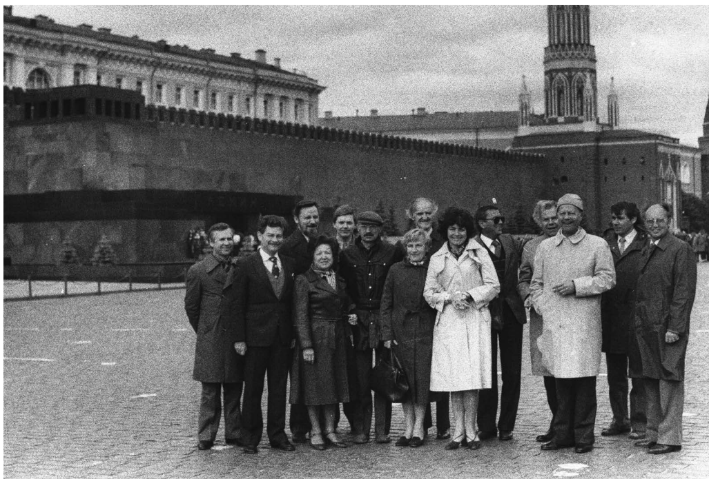
1984, mednarodna konferenca o izobraževanju odraslih v Moskvi.