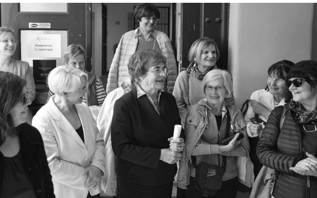
2018, v Ljubljani med študenti in mentorji ljubljanske UTŽO ob odprtju razstave V življenju vstopaš in izstopaš skozi nešteto vrat.