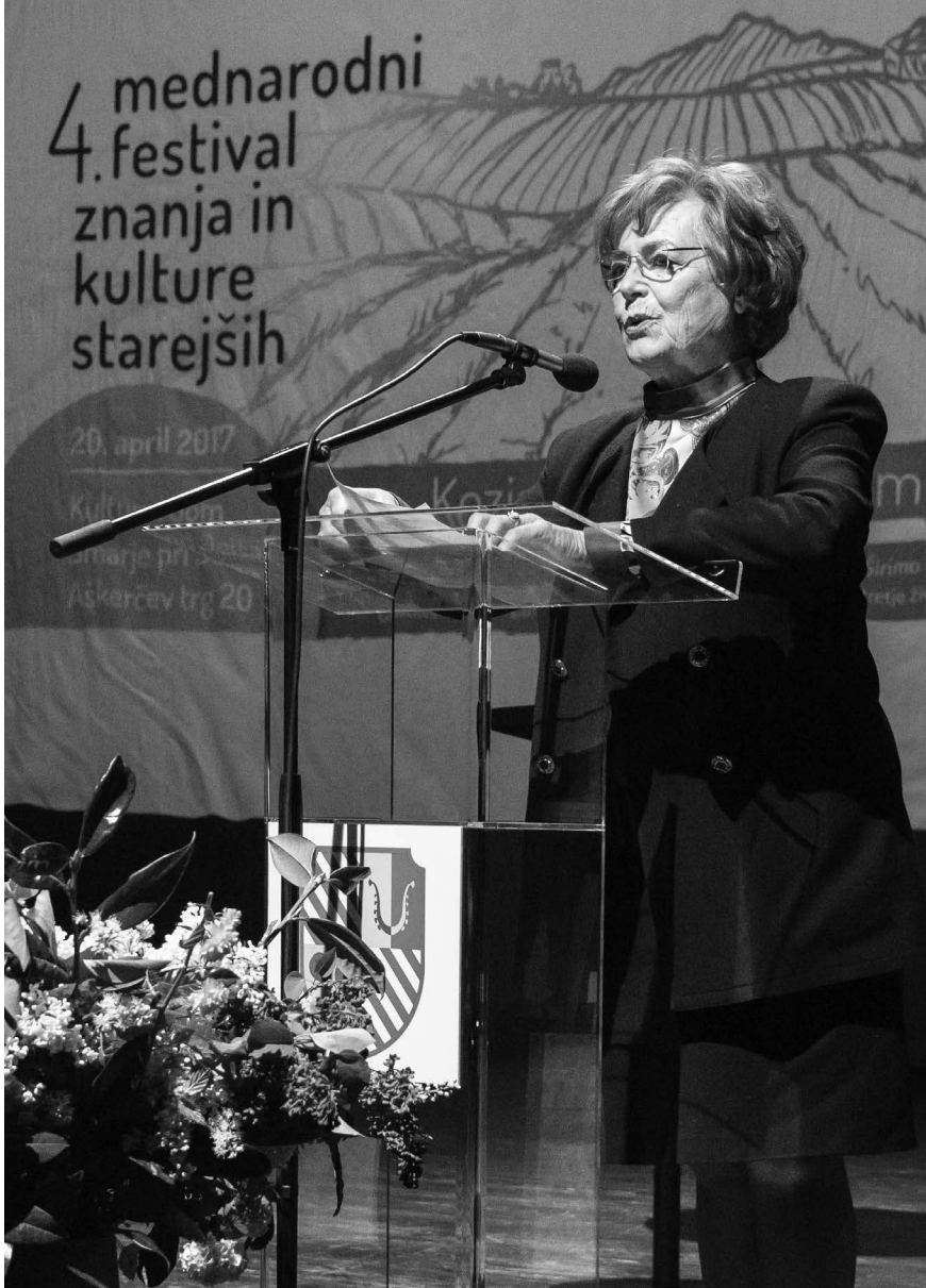
2017, na odprtju 4. mednarodnega festivala znanja in kulture starejših, Šmarje pri Jelšah.