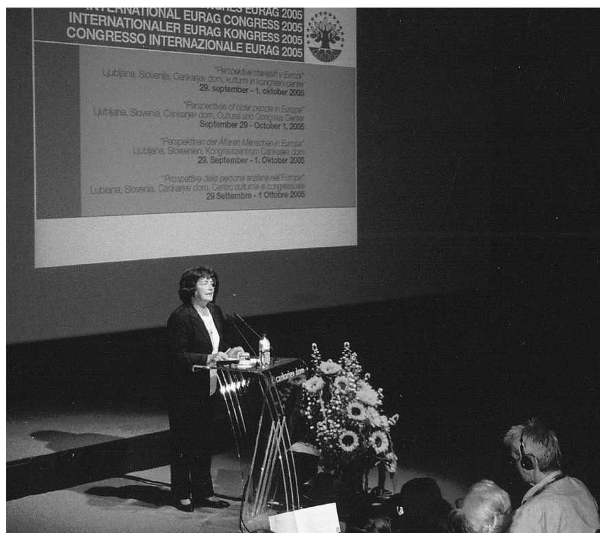
2005, kongres EURAG v Cankarjevem domu v Ljubljani.