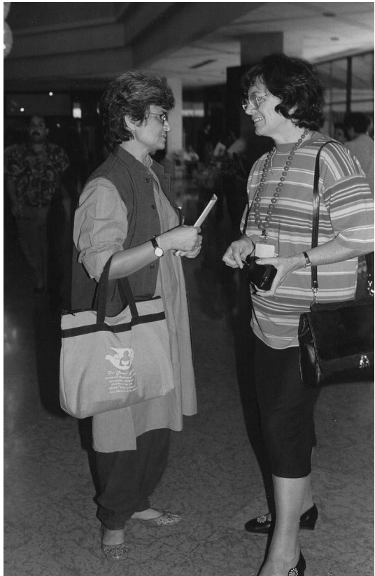
1993, peti svetovni kongres ICAE v Kairu v Egiptu.