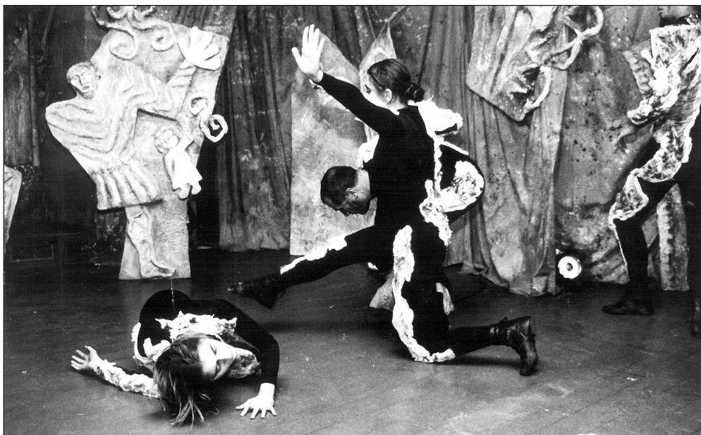
SARTR – Sarajevski ratni teatar: Odkamen . Režija: Dubravka Zrnčić-Kulenović. Premiera: leta 1996. Gostovanje predstave na festivalu Ex Ponto leta 1998.