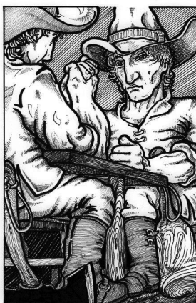
Merjenje moči (Trobič 2005).

Tu mislim predvsem nekaj stoletni boj habsburškega dvora proti Beneški republiki. Tako so denimo Benetke, nekdanja bizantinske uprave v severnem Jadranu, nato svobodna oligarhična republika, s svojim imperializmom tekmovali s cesarstvom. Le-to jim ni odgovarjalo samo z vojaško silo, temveč tudi z administrativnimi in gverilskimi postopki. Kot svoje pristanišče je ščitilo Trst, spodbujalo in ščitilo uskoške pirate iz Senja ter obnovljalo njihovo populacijo s prišleki iz Krajine. Poleg tega je dopuščalo in nemara celo spodbujalo kontrabant in tihotapstvo, ki sta posegala v beneške monopole in omogočala – prek kranjskih in štajerskih kmečkih prekupčevalcev – prehajanje piratskega plena iz Trsta v notranjost celine. (Rotar 1993: 158–9)