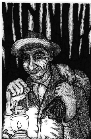
Kontrabantar (avtor: Marino Samsa; Trobič 2005).

Martin Krpan predstavlja osebo, ki nosi močan junaški naboj, postavljen v hojo po robu, med zakoni države, legalnostjo in legitimnostjo preživetja. Krpan uporablja strategije ravnanja, ki so značilne za predstavnike obmejnih, majhnih narodov in tako imenovane mediteranske družbe. Tako na primer na Siciliji goljufanje države ni bilo nikoli zločin. Družbe v Sredozemlju namreč nosijo v sebi globoko zakoreninjen odpor proti javni oblasti, državi in njenim zastopnikom. Ti predstavljajo moč, katere glavna značilnost je, da je »šibka do močnih in močna do šibkih« (Giordano 1995: 61). Tu seveda ne gre samo za značilno mediteransko ravnanje, saj se podobno dogaja, na primer, tudi v Vojni krajini, med Uskoki, na številnih mejnih področjih in drugod.