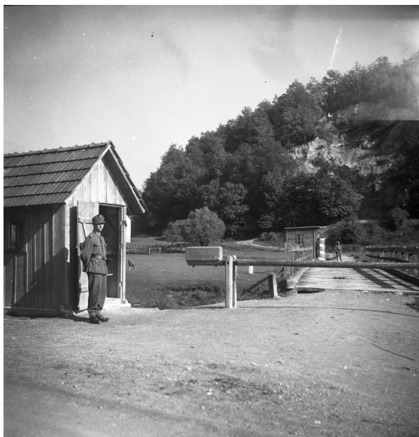
Slika 2: Mejni prehod med Nemčijo in Neodvisno državo Hrvaško pri Harinih Zlakah (Podčetrtek).

upravno mejo preteklih državno-političnih tvorb na tem območju, Sotla je namreč bila že stoletja narodna meja med Slovenci in Hrvati. Ta spodnještajerska meja na Sotli je poleg nemške meje z Italijo postala najjužnejša, zaščitna meja napovedanega tisočletnega Tretjega rajha. Zato je nemška uprava obmejni pas etnično očistila: deportirala Slovence in naselila kočevske Nemce ter zgradila in vojaško zavarovala svojo južno državno mejo. Začetna utrjevalna dela so se zaključila do pozne jeseni 1941. Nemci so mejo zavarovali z bodečo žico, minskimi polji in vmesnimi graničarskimi stražarnicami, marca 1943 pa so bili izdani tudi sklepi o nujni izgradnji stražnih stolpov. Žico, ki je bila visoka do dveh metrov, so namestili na lesene stebre, ki so bili ob rečni strugi zabiti enakomerno na vsakih nekaj metrov. Širina linije minskega polja ob žici je znašala približno od dva do štiri metre.