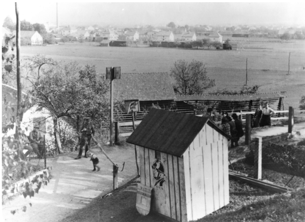
Slika 5: Italijansko-nemški mejni prehod na sedanji Podgorski cesti v Ljubljani, tik nad križiščem s Cesto Andreja Bitenca, po kateri je potekala okupacijska meja. Gre za pogled proti Ljubljani, v ozadju se vidijo njive in travniki, ki so danes večinoma pozidani s stanovanjskimi bloki. Nedaleč stran, v bližini križišča Ceste Andreja Bitenca s Celovško cesto, je bil še en mejni prehod.

zato, ker je bila to tedaj mnogo širša cesta, pravzaprav glavna prometna žila, ki je mimo Ljubljane šla z Gorenjske v Trst in po kateri so furmani prevažali les. S postavitvijo meje med vojno in s kasnejšimi urbanističnimi spremembami je cesta izgubila pomen. 51