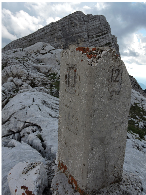
Slika 3: Sektorski mejnik št. 12 rapalske meje med Kraljevino Italijo in Kraljevino Jugoslavijo na Prehodavcih v Julijskih Alpah, ki je ostal mejnik tudi v času druge svetovne vojne, ko je razmejeval Italijo in Nemčijo. Sektorski mejniki so bili visoki en meter in široki 40 cm. Črka »D« je označevala Nemčijo. Letnica 1920 označuje leto podpisa rapalske pogodbe.

Gadovi peči. Sedem slovenskih vasi pod Gorjanci je pripadlo NDH, ki jih je vključila v svoj upravni sistem, izvajala nasilno hrvatizacijo in izseljevala ljudi. Izsledila je tudi duhovnike, tako da je bila duhovna oskrba le občasna, prihajala pa je iz frančiškanskega samostana v Samoborju. Da bi preprečili prehajanje meje slovenskim in hrvaškim partizanskim brigadam v Beli krajini, so Italijani nameravali mejo na Gorjancih/Žumberku utrditi s pasom žične ograje in bunkerji. Ob Kolpi navzgor naj ne bi bilo žične ograje, ampak samo utrjeni mostovi in drugi objekti. Zaradi kapitulacije jim je spomladi 1943 uspelo zgraditi le šest bunkerjev pri Metliki. Meja je močno zarezala v vsakdanje življenje ljudi, zelo so bili prizadeti predvsem kmetje, ki so imeli zemljo na obeh straneh meje. Prebivalci Žumberka s pravoslavnimi koreninami v pričevanjih, ki smo jih zbrali, izražajo mnenje, da je meja tudi koristna, ker je ustašem preprečevala, da bi prihajali na italijansko okupirano območje. Rešilo jih je že to, da so pri razmejitvi zaradi upoštevanja prejšnjih jugoslovanskih in avstro-ogrskih notranjih meja prišli pod Italijo in ne pod