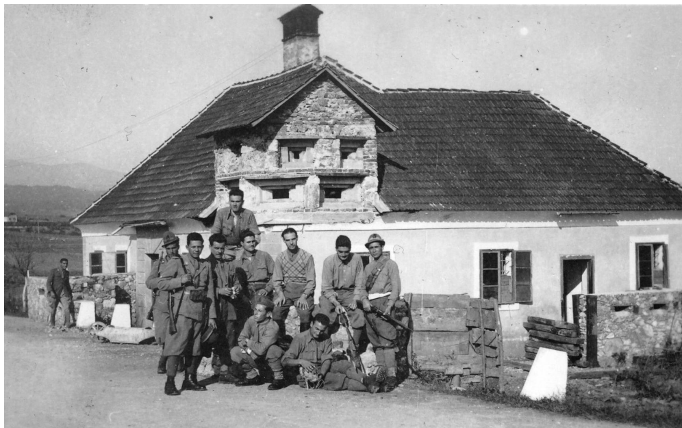
Slika 4: Italijanska vojska je hišo pri mostu čez Kolpo pri Metliki spremenila v bunker, november 1942.

NDH. Med vojno so se poleg drugih težav spoprijemali tudi z begunštvom iz NDH, še posebej židovskega prebivalstva. 41 Del prebivalstva pa s tem, da so prišli pod Italijo, ni bil zadovoljen. Maja 1941 so bili tudi posamezni poskusi, da bi se del sreza Črnomelj (Bele krajine) priključil NDH (Občina Radatoviči) 42 in tudi poskus, da se celotna Bela krajina priključi nacistični Nemčiji. 43