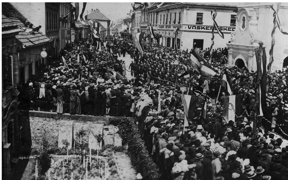
Slika 1: Prihod madžarske vojske v (Dolnjo) Lendavo 16. aprila 1941.

nemško-jugoslovansko-madžarske tromeje. Te so nemško-jugoslovansko mejo prestopile na treh odsekih in začele prodirati v notranjost Prekmurja do reke Ledave. Naslednji dan, 7. aprila, se je del teh enot obrnil proti jugu in prikorakal v Mursko Soboto. Potem ko so enote 183. pehotne divizije 8. aprila zasedle desni breg Mure (središče Međimurja, Čakovec, so zasedli že dan prej), so imele preostale nemške enote v Prekmurju le še zasedbene in varovalne naloge. Čez dva dni, 10. aprila, so Nemci vzpostavili vojaško upravo za okraja Murska Sobota in Lendava, ki pa ni ostala dolgo, saj so Nemci že 16. aprila oblast nad pokrajino na levem bregu Mure predali Madžarom. 8