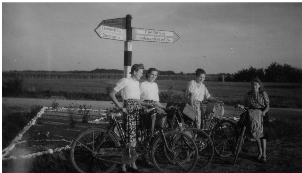
Slika 7: Kažipot z madžarskimi krajevnimi imeni pri odcepu za Nedelico v bližini Turnišča.