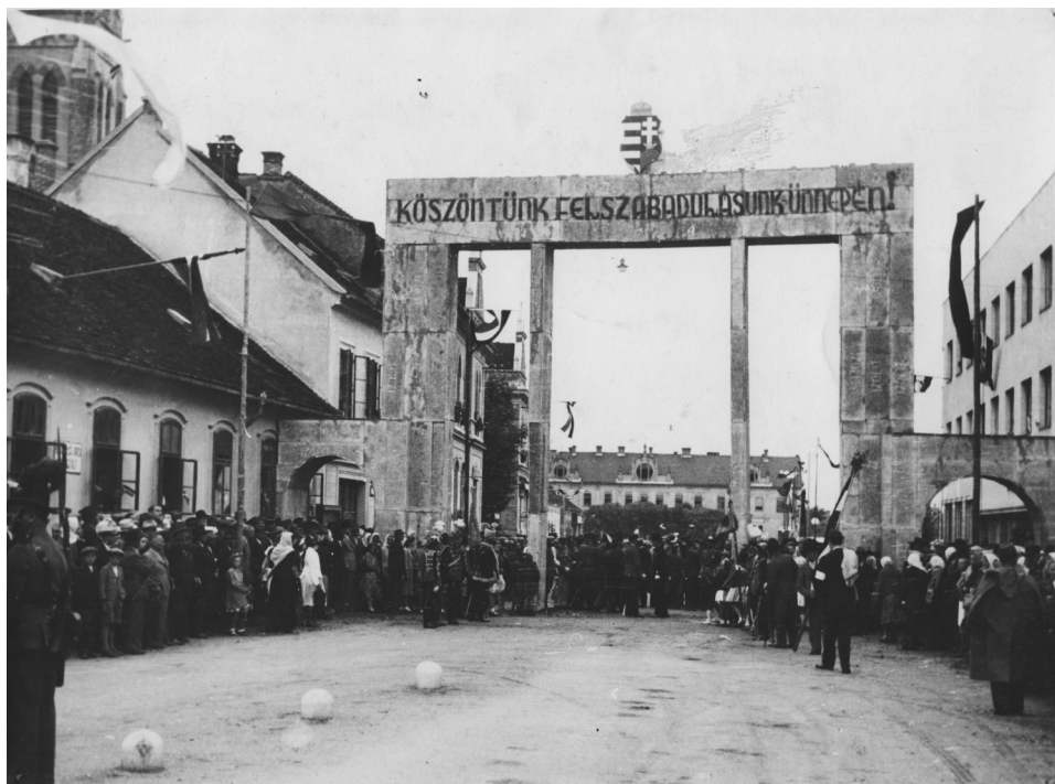
Slika 2: Slavolok za napisom »Pozdravljamo vas ob prazniku osvobojenja«, postavljen v Murski Soboti ob svečanosti 29. junija 1941.

delegacija 32 naselij, med njimi so bila vsa naselja z večinskim madžarskim prebivalstvom ob jugoslovansko-madžarski meji in 10 slovenskih naselij, v prostorih okrajnega nadglavarja ( főszolgabíró ) v Lentiju podpisala zapisnik, v katerem so Madžarsko in njenega voditelja Horthyja prosili, naj madžarska vojska in uradništvo zasedeta Prekmurje. K zapisniku so priložili tudi seznam z 835 podpisi. 19