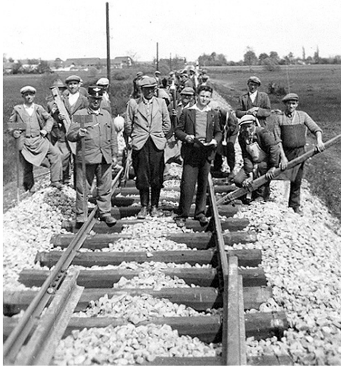
Slika 9: Delavci med polaganjem tračnic pri Hodošu leta 1941.

med Dolgo vasjo in državno mejo odstranile. Uslužbenci madžarskih državnih železnic (MÁV) so v promet sprva vključili Mursko Soboto, ki so jo povezali s Körmendom in z županijskim središčem v Sombotelu (Szombathely). Motorni vlaki, ki so štirikrat dnevno odhajali iz Murske Sobote, so začeli voziti 5. maja 1941. 56 V začetku junija so v madžarsko železniško omrežje integrirali tudi Dolgo vas, 57 do oktobra 1941 pa so prek Dolnje Lendave z Zalaegerszegom povezali še Čakovec. 58 Kljub dokaj hitri vzpostavitvi infrastrukturne povezave z notranjostjo države so zaradi spremenjenih gospodarskih razmer tovarniški obrati v Murski Soboti zašli v težave. Kot je razvidno iz članka, objavljenega v tedniku MéV 17. oktobra 1941, so vse štiri soboške tovarne, Benkojeva tovarna mesnih izdelkov, Dittrichova tovarna kovin in pločevin ter tekstilni tovarni Cvetiča in Šiftarja delale le s polovičnim obratom. 59 Zaradi aprilske vojne in posledično zaradi spremenjenih geopolitičnih razmer so imeli tudi številni prekmurški sezonski delavci težave pri iskanju službe. S problemom sezoncev so se takoj soočile tudi madžarske vojaške oblasti, ki so del sezoncev preusmerile na madžarska veleposestva. 60