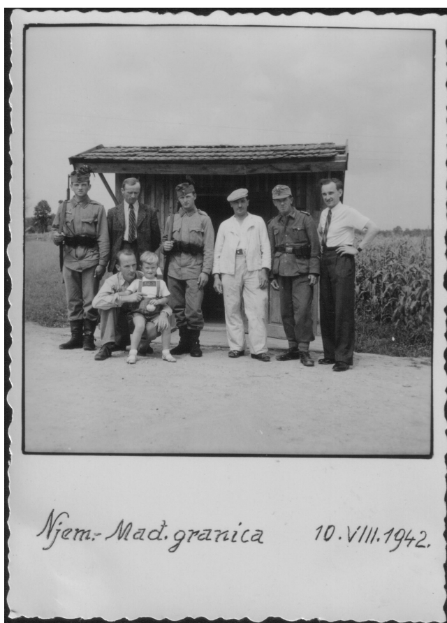
Slika 3: Madžarski in nemški orožniki s civilisti na nemško-madžarski meji leta 1942.

Še med vojaškimi operacijami v Jugoslaviji je vodja Nemčije, Adolf Hitler, z ukazom z dne 3. in 12. aprila razdelil Slovenijo med tri okupatorje. Jugozahodni del Dravske banovine so dobili Italijani, Nemci so zasedli osrednji del Slovenije, vzhodni del oziroma Prekmurje pa je pripadel Madžarski. Meddržavne razmejitvene komisije so takoj začele delati in so mejo določile do 11. junija 1941. Mejo med Madžarsko in Nemčijo so v bistvu zarisali tam, kjer je med ogrskim in avstrijskim delom potekala v času avstro-ogrske monarhije, s to razliko, da so naselja Fikšinci, Kramarovci, Ocinje in Rottenberg (del Serdice) z večinskim nemškim prebivalstvom, ki so v obdobju med obema vojnama (kakor tudi v času AOM) pripadala murskosoboškemu okraju, priključili Nemčiji. 27