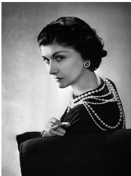
Slika 2: Coco Chanel z biseri