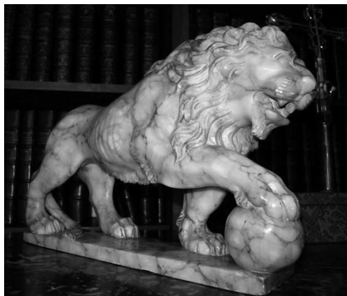
Slika 4: Lev, ki krasi dom Coco Chanel na Rue Cambon

Lev je pomembna simbolna žival že vse od časa starih visokih civilizacij. Njegova simbolika se je skozi dolga tisočletja bogatila v okviru različnih kultur ter verskih praks. Pomen leva je moč strniti na nekaj ključnih besed, ki so se sčasoma neločljivo povezale z njim: odličnost, bojevitost, moč, pogum, neustrašnost, dostojanstvo in svoboda, po drugi strani pa tudi krutost (Germ 2006: 113, 119). Coco Chanel si ni težko predstavljati in povezati s temi izrazi ob misli na njene skromne začetke in vse, kar je kljub oviram dosegla v življenju.