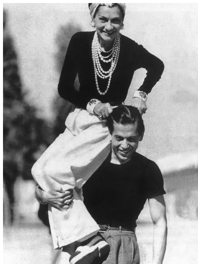
Slika 7: Coco Chanel in Arthur 'Boy' Capel

Seveda pa je Coco imela tudi svojo razlago za prevzeto ime. Prijatelju in biografu Marcelu Haedrichu je namreč razložila, da jo je tako klical oče; ker mu ime Gabrielle ni bilo pri srcu in jo je klical »mala Coco,« kasneje pa le še Coco. To ni mogoče, saj očeta po materini smrti ni več videla. Zdi se, da je bila v resnici Coco tista, ki ni marala imena Gabrielle, verjetno zaradi spominov na travmatično otroštvo, in se je iz tega razloga imenovala Coco, kasneje v življenju pa le še Mademoiselle. Haedrichu je dejala, da je njeno ime Coco, ime Gabrielle pa uporablja v skrajni sili, na primer pri podpisovanju uradnih dokumentov (Haedrich 2008: 21–22). Gabriellina izbira imena Coco se je izkazala za ključno pri oblikovanju logotipa modne hiše Chanel.