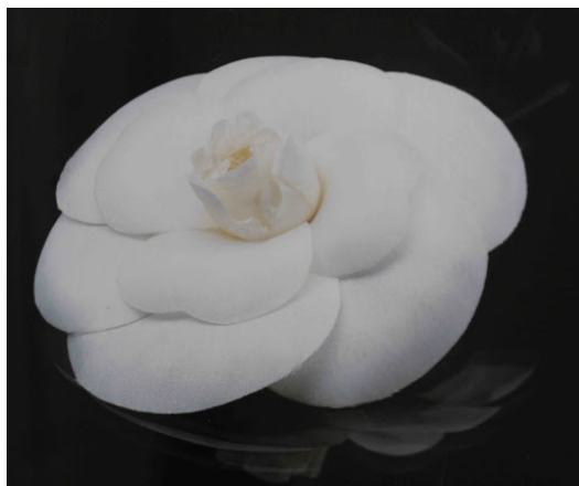
Slika 3: Chanel broška z belo kamelijo

Rod kamelij prihaja iz Azije, najbolj znana izmed vrst pa je japonska kamelija ( Camellia japonica ). Čeprav so bile kamelije v Evropi prisotne že prej, so višek svoje priljubljenosti doživele v 19. stoletju (Wells 1997: 33–34). Bela kamelija predstavlja predanost, občudovanje ter čisto in nedolžno ljubezen. Dokaj enakomerno razporejeni cvetni listi uravnovežijo cvet in ponujajo asociacijo na popolnost.