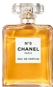
Slika 6: Parfum Chanel N° 5

Veliki vojvoda Dmitri Pavlovič je leta 1920 Coco Chanel predstavil izdelovalca parfumov Ernesta Beauxa. Beaux je nato zanjo razvil dve liniji vonjev, označenih s števili od 1 do 5 ter od 20 do 24, ter jih ponudil Coco na izbiro. Ko je izbrala vonj, ki je nato postal eden izmed prvih parfumov z aldehydi na svetu, dišavi ni naredla osladnega in privlačnega imena, kot je bilo v navadi. V svojem preprostem slogu ga je poimenovala Chanel N° 5. Poleg imena je bil popolnoma nov tudi njegov videz, saj je bila steklenička zelo preprosta, a elegantno okrašena. Parfum je naprodaj vse od leta 1921 in je z imenom, vonjem ter stekleničko prerasel v enega izmed Cocojinih simbolov (Gidel 2000: 172; Charles-Roux 1974: 350).