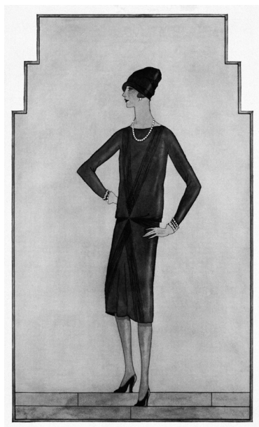
Slika 1: Prva mala črna obleka

minimalističen način življenja je vplival na njen osebni slog oblačenja, ki ga je dalje razvijala kot modna oblikovalka. Ti vplivi se lepo kažejo v njeni prelomni iznajdbi, mali črni obleki.