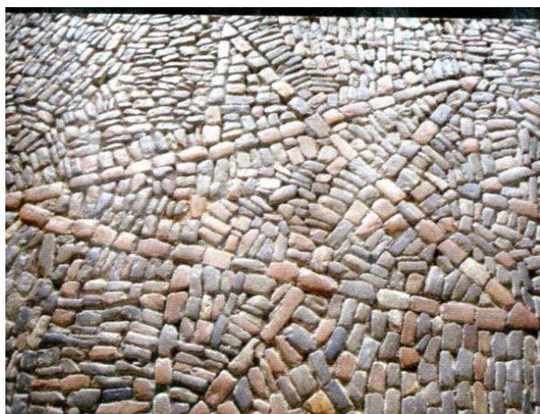
Slika 5: Peterokraka zvezda iz talnega mozaika samostana v Aubazinu

se nahajajo tudi luna, sonce ter peterokrake zvezde, morda celo število 5, ki naj bi pomenilo svetlo prihodnost (Gidel 2000: 36). 4 Peterokraka zvezda je imela v Aubazinu poseben pomen. Samostan se je kot cistercijanska arhitektura povezoval s skrivnostmi vitezov templjarjev, pri katerih je bilo število pet ključno. S pomočjo arhitekture je število pet Gabrielle spremljalo več čas. Ni presenečenje, da je postalo njeno najljubše število (Mazzeo 2010: 8–9; Fiemeyer 2004: 27). Zvezda, sonce in luna so postali del njenih modnih kreacij ter nakita, močno pa jo je pritegnila tudi numerologija.