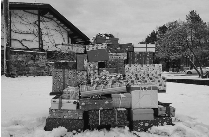
Slika 3: Darila, ki so bila leta 2020 zbrana v akciji Božiček za en dan na zbirni točki v Tolminu (Klub tolminskih studentov, 2020).