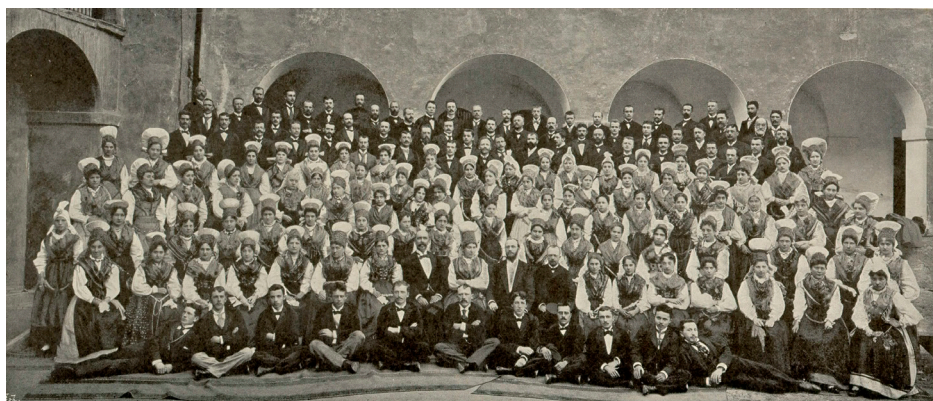
SLIKA 2.2 Pevski zbor Glasbene matice na Dunaju, marec 1896.