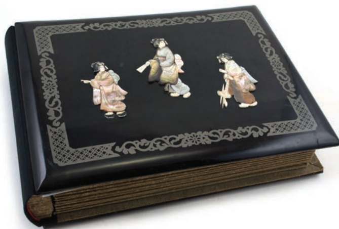
Slika 3: Album razglednic s potovanj v Vzhodno Azijo Ivana Koršiča po restavriranju v Arhivu Republike Slovenije leta 2013 (PMSMP, foto Snježana Karinja, 2016).

Ivan Koršič se je rodil leta 1870 v Solkanu. Tam je obiskoval osnovno šolo, nato pa je šolanje nadaljeval v Gorici, kjer je leta 1890 vstopil v bogoslovno semenišče. Po letu 1893, ko je prejel mašniško posvečenje, je nekaj let maševal v Volčah, Rihembergu (današnjem Braniku) in na Travniku na Goriškem, leta 1899 pa je dobil službo vojaškega kaplana v vojni mornarici (Podberšič 2010, 142; Stres 1991, 229–230). Z leti je napredoval. Leta 1907 je postal mornariški kurat, leta 1911 mornariški višji kurat in leta 1915 mornariški superior. Služboval je večinoma v mornariškem oporišču v Puli. V letih 1903–1906 je bil na bojni ladji Arpad, ki je križarila po Sredozemlju, pretežno po Jadranu, med prvo svetovno vojno pa je služboval tudi v puljski mornariški bolnišnici (PMSMP Koršič). Po razpadu Avstro-Ogrske je leto dni ostal v italijanski vojni mornarici v Puli, nato se je vrnil v Solkan. Nekaj časa je maševal v bližnjem Štmarvu, po upokojitvi leta 1920 pa so ga imenovali za župnika in dekana v Kobaridu. Umril je leta 1941 v Solkanu (Podberšič 2010, 142).