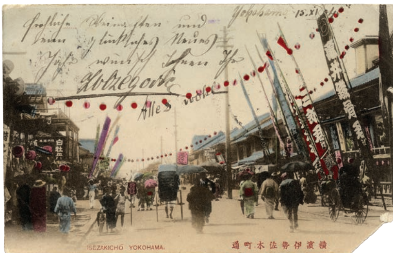
Slika 5: Ulica Isezakichō v Yokohami. Razglednico je Zvonimir Ožegović poslal Ivanu Koršiču iz Yokohame 15. novembra 1904 (album razglednic Ivana Koršiča, PMSMP).