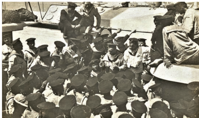
Slika 14: Razdeljevanje pošte na ladji avstro-ogrske vojne mornarice (album razglednic in fotografij Avgusta Blaznika, PMSMP).

Razglednice, ki so na prehodu v 20. stoletje, v njihovi zlati dobi, ki je trajala do konca prve svetovne vojne (Premzl 1997, 384), postale priljubljeni zbirateljski predmeti, so pomorščaki kupovali tudi kot spominke, 6 predmete, ki so jih domov prinesli z namenom ohranjanja spomina iz daljnih dežel zase