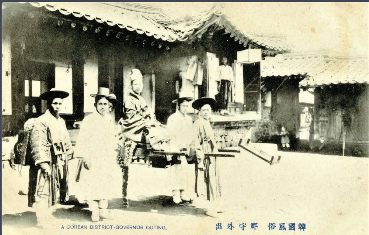
A COREAN DISTRICT-GOVERNOR OUTING.