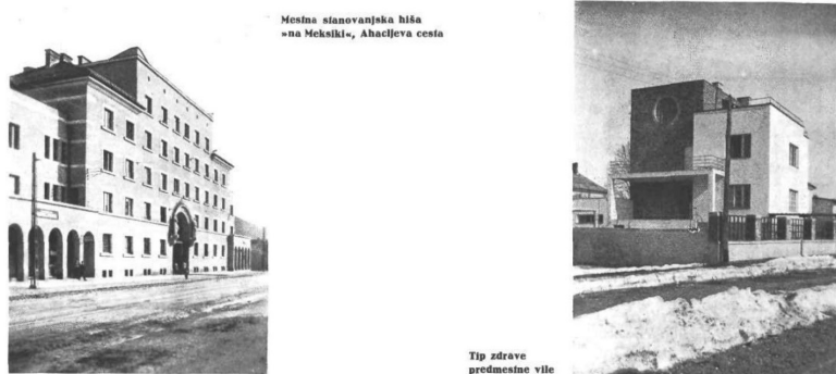
Slika 2: Levo Petričev prikaz »nezdrave« mestne večstanovanjske hiše Meksika in desno prikaz »zdrave« predmestne vile na Vrtači (Petrič 1934)

Petričev zapis kot artikulacija skrbi mestnih oblasti za higieno javnega prostora ne izraža razrednih razlik zgolj s tem, da skozi diskurz socialne medicine primerja čutne ponudke ( sensory affordances ) 7 posamične stanovanjske gradnje in prostora nasploh, temveč tudi tako, da meščanski standard postavlja kot obči življenjski standard, ne glede na razredni izvor. Za vzoren tip bivanjske kulture tako postavi meščansko vilo, graja pa delavsko večstanovanjsko hišo in njeno neposredno okolico.