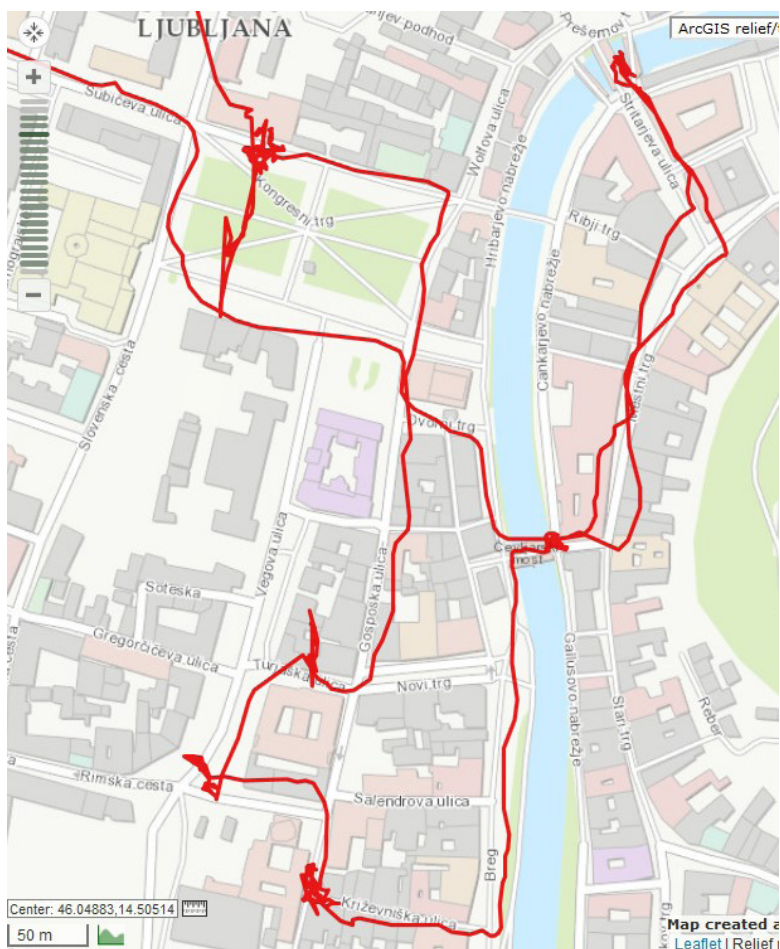
Slika 1: Delna rekonstrukcija poti Franciškinoga čutnobiografskega sprehoda na podlagi GPS-koordinat

Preden se posvetimo Franciškini pripovedi, si oglejmo, kako je bila čutna krajina spreminjajoče se Ljubljane opisana v takratnem časopisu in kako so modernizacijo mesta razumeli raziskovalci kulturne zgodovine.