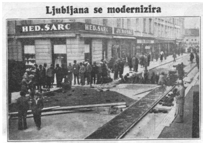
Slika 5: Zbirka nesmrtnega ljubljanskega firbca leta 1931 opazuje tlakovanje današnje Slovenske ceste (Tedske slike. Priloga Domovini, 27. 5. 1931)

stvaritev nove čutne atmosfere v ljubljanski urbani krajini ter kako se je modernizacija Ljubljane »odražala« skozi čutno zaznavo. Nekateri so v svoji analizi izhajali iz krogov, bližje kulturni zgodovini čutov, drugi pa so o modernizaciji zaznavanja ter raznolikih čutnih vtisih z lakoničnostjo pisali v anekdotah in noticah. Skupno jim je, da niso spregledali sprememb v urbanem prostoru na začetku 20. stoletja, ki so se dotikale telesa, naj si bo to vprašanje bivanjske kulture, deodorizacije mestnega središča ali higienizacije ter estetizacije javnega prostora.