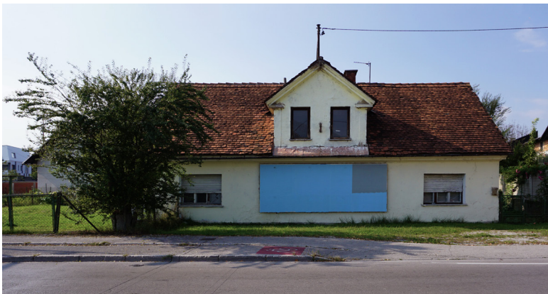
Slika 4: Primer na novo postavljene oglasne panoje na zasebni nepremičnini (Danilo Milovanović, Ljubljana, 2019)

Tovrsten način oglaševanja je, podobno kot fenomen začasnih parkirišč, nejasno reguliran in kot tak lahko invaziven. Sodobne strategije oglaševanja v javnem prostoru že desetletja presegajo format tiskanega plakata. To se danes najizraziteje kaže na primeru digitalnih reklamnih ekranov, ki ob svoji primarni funkciji predstavljajo tudi nezanimljiv vir svetlobe. Njihova nekontrolirana prisotnost na javnih prostorih ustvarja vzdušje, podobno tistemu v nakupovalnih središčih (Černigoj 2015). Gre za primer problematike, ki jo označujemo z izrazom »vizualno onesnaženje« (Enache, Morozan in Purice 2012: 822–824).