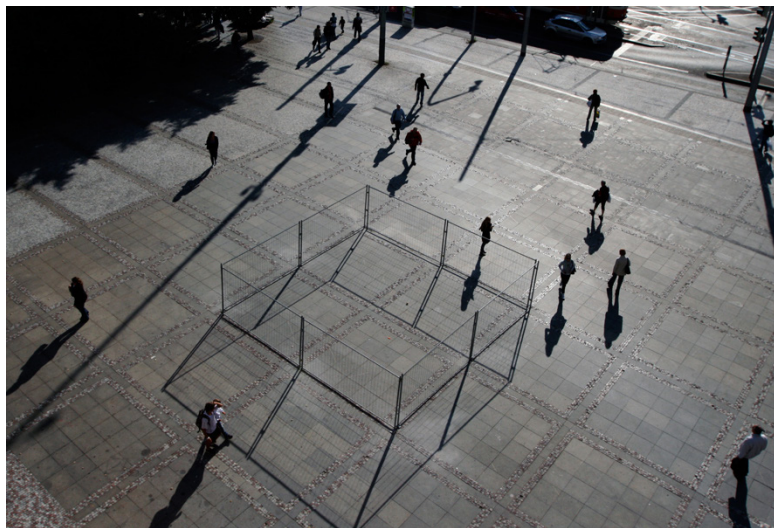
Slika 3: Epos 257, 50 m 2 javnega prostora, intervencija v javni prostor (Epos 257, Praga, 2010)

rabo. Zaprt in prazen prostor je ostal neprehoden kar štiriinpetdeset dni, vse dokler ni mestno redarstvo odstranilo ograje (glej Epos 257 2010).