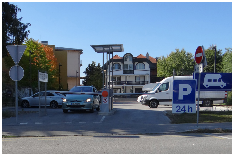
Slika 1: Primer plačljivega parkirišča na zasebnem dvorišču (Danilo Milovanović, Ljubljana, 2018)

Na opisani poslovni model in specifično upravljanje prostora sem opozoril leta 2018 z umetniškim posegom TOP Parkirišče . Gverilska intervencija je zajemala vzpostavitev parkirišča, ustvarjenega na vozilom nedostopni strehi podzemne garaže. Ta je v strogem središču mesta, natančneje ob Parku slovenske reformacije na Puharjevi ulici. Streha je vidna in fizično dostopna zgolj mimooidnim in okoliškim stanovalcem, saj je nadzemni del sicer podzemne garaže ločen od okolice, tako da se za slab meter dviga nad neposredno okolico. Sledil sem principu minimalne infrastrukturne investicije omenjenega poslovnega modela in se tako omejil na dva osnovna elementa, ki sta vselej prisotna na začasnih parkiriščih: talne oznake parkirnih mest in blagajna za plačevanje parkirnine. Na omenjeni lokaciji sem vzpostavil situacijo, pri kateri sem z geometrijsko risbo in improvizirano blagajno ustvaril formo parkirišča, ki kljub uporabnemu potencialu ostaja prazno in brez praktične vrednosti. Po dveh tednih so predstavniki stanovanjske skupnosti ob objektu pustili pisno opozorilo o prepovedi uporabe strehe z zahtevo po odstranitvi objekta. Ker sem avtentično blagajno želel ohraniti kot artefakt, sem jo odstranil. Kljub temu je mreža zarisanih parkirnih mest zaradi obstojnosti uporabljene barve do danes ostala sestavni del tega specifičnega prostora (Milovanović 2019).