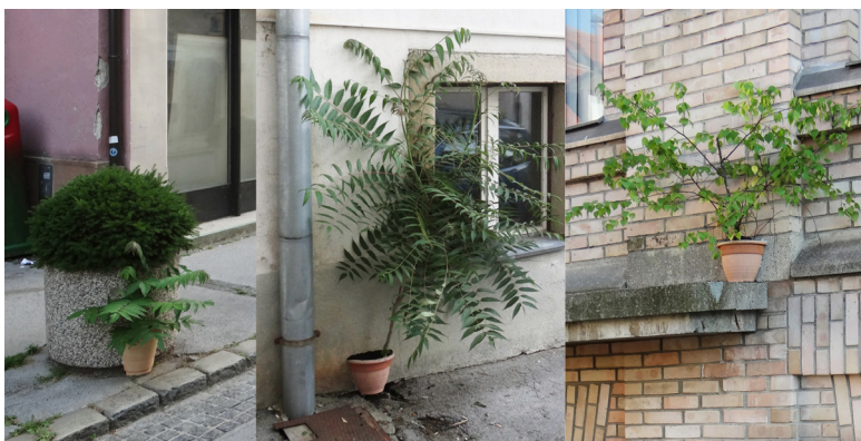
Slika 10: Danilo Milovanović, Kultivacija , intervencija v javni prostor (Danilo Milovanović, Celje, 2018)

kot plevel, odstranjevanje katerega se šteje za vzdrževanje javnega prostora. Ta proces uničevanja in vedno novega pojavljanja »plevel« doživljam kot uprizorjen trk med kulturo in naravo. Da bi poudaril prisotnost samoniklih rastlin v urbanem okolju, sem »kultiviral« prav te rastline. Po zgledu gojenja okrasnih rastlin v estetiziranih betonskih koritih sem za namen intervencije Kultivacija priredil cvetlične lončke, s katerimi sem zaobjel dele arhitekture, iz katerih so se rastline prebijale na površino. Nekateri primeri so se ohranili in popolnoma integrirali v okolico. Serijo opisanih intervencij sem izvedel leta 2018 v mestnem jedru Celja (glej Milovanović 2018).