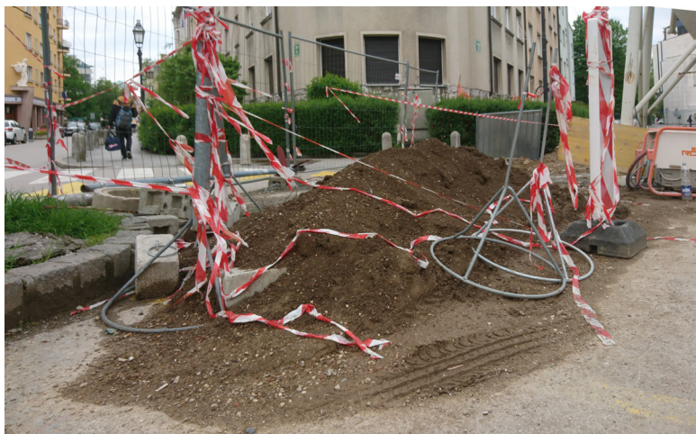
Slika 12: Urbana prenova (Danilo Milovanović, Ljubljana, 2019)