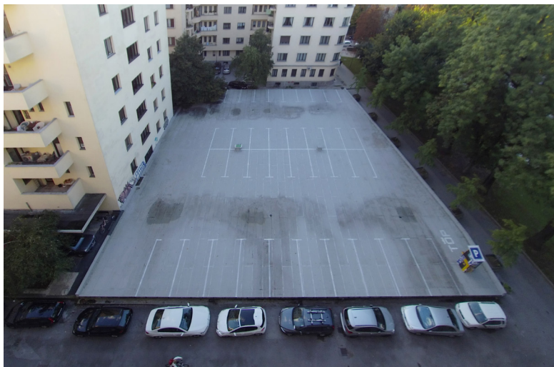
Slika 2: Danilo Milovanović, TOP Parkirišče , intervencija v javni prostor (Danilo Milovanović, Ljubljana, 2018)

Modernistična logika obravnava odprt, nepozidan prostor med arhitekturnimi objekti kot vitalen del širšega prostorskega kompleksa. Praznina ima namreč funkcijo poudarjanja, monumentaliziranja obstoječih form, hkrati pa v stanovanjskih soseskah izboljšuje pogoje bivanja. Pri tem so razgled iz stanovanja in njegova svetlost ter potencial parkov, sprehajališč in otroških igrišč, ki ga omogoča nepozidan prostor, pomemben del prostorskega koncepta. Toda z vidika poznega kapitalizma in njegovega vpliva na prostorsko logiko je nepozidana površina znotraj urbanega prostora razumljena kot potencial za nove investicije.