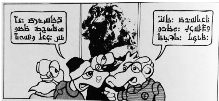
Slika 5: Nezemljani in njihov govor v stripu Avtoportret s paletjo Romea Štrakla.

Vrsta in slog pisave se pogosto spremenita tudi, kadar govorec govori v tujem jeziku, s čimer je ponazorjen drugačen slušni vtis (Slika 4). V primeru, da ni pomembno, kaj govorec izreče, pa je lahko za zapis pisave uporabljena tudi izmišljena pisava