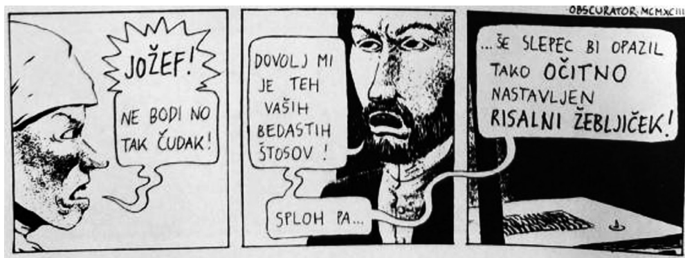
Slika 3: Oblček z nazobčanim robom v stripu Doma Jakoba Klemenčiča.

Oblika oblčka oziroma nazobčanost njegovega roba lahko nakazuje glasnost ali kričanje (Slika 3), kar je lahko ponazorjeno tudi na druge načine: z intenzivnim barvnim odtinkom govornega oblčka (npr. rdečo ali oranžno barvo), seganjem besedila čez rob oblčka ali že omenjenim seganjem celega govornega oblčka čez rob stripovskega okvirčka.