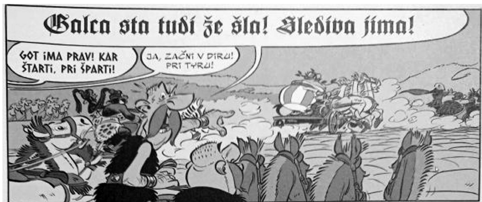
Slika 4: Uporaba različnih pisav za izražanje tujih jezikov v Asterixu .

ali njegovo čustveno stanje med govorjenjem (Mikkonen 2017: 226, 227). Oblaček z nazobčanim robom na Sliki 3 tako ne označuje le glasnega govorjenja, ampak gre v tem primeru tudi za izražanje jeze, kar lahko izberemo iz obrazne mimike, rdečice na obrazu govorce in celotnega konteksta, podobno pa lahko pomen oblike oblačka ali vrste oziroma značilnosti pisave v njem prepoznavamo tudi v drugih primerih – tresoča pisava in rob oblačka tako lahko prikazujeta nestabilen položaj govorca, njegov strah ali to, da ga zebe, pri čemer točen pomen razberemo iz vizualnega konteksta, plešoče črke v kombinaciji z zariplim obrazom govorca pa označujejo pijanost (Forceville, Veale, Feayaerts 2010: 11).