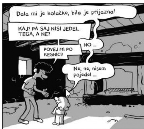
Slika 2: Veriga govornih oblakov v stripu Arabec pribodnosti Riada Sattoufa.

To, da so oblaki umeščeni eden čez drugega tako, da se le deloma prekrivajo, lahko bralcu sporoča tudi, da sodijo skupaj – da so govorne izjave izrečene v kratkem časovnem zaporedju oziroma jih izreka isti govorec. Pogosto so izjave istega govorca v stripih zapisane tudi v verigi govornih oblakov (Slika 2), pri kateri ožji prostor na mestu, kjer so oblaki povezani med seboj, označuje kratke premore v govoru (Mikkonen 2017: 235), hkrati pa takšna veriga tudi usmerja branje ali celo vodi bralca iz prizora v prizor.