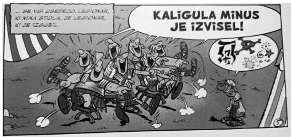
Slika 7: Različni simboli in znaki za izražanje preklinjanja v stripu o Asterixu.

Še posebej pogosto pa se vizualne oblike govora uporabljajo za izražanje preklinjanja, s čimer gre po eni strani za izogibanje neposrednega zapisa kletvic ali vulgarnih izrazov, ki so tako nadomeščeni z različnimi simboli in znaki (Tang 2013: 21), po drugi strani pa je s tem poudarjena tudi njihova slikovitost oziroma ekspresija, pa tudi čustveno stanje (jeza) govorca (Slika 7).