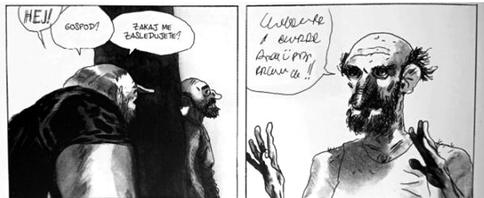
Slika 8: S čačkami je v stripu Blast Manuja Larceneta poudarjena nerazumljivost govora v tujem jeziku.

ponazarja, da je govorec naročil kavo ali čaj) ali pa gre za likovno upodobitev nečesa – na Sliki 9 tako v govornem oblaku vidimo pol žensko, pol kačo, bitje, o katerem pripoveduje govorec na sliki. O čem govori, dodatno pojasnjuje tudi besedilo v okvirčku na vrhu prizora. Podoba v govornem oblaku simbolizira celotno zgodbo, ki jo je govorec (in bralec) izvedel na prejšnjih straneh stripa.