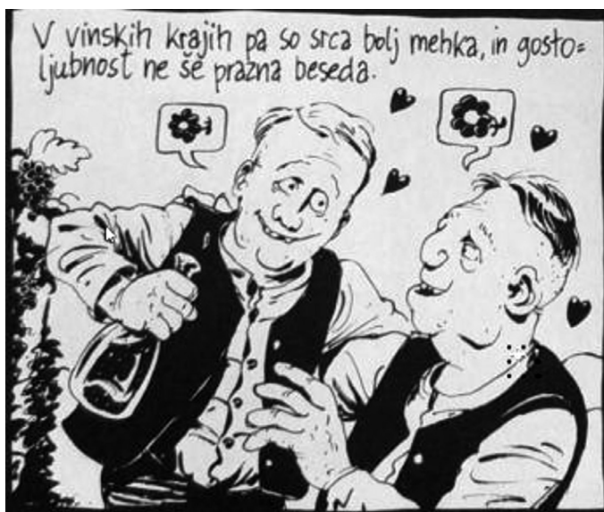
Slika 6: Vizualna oblika govora v stripu Etnološki zapisi Janeza Trdine Jakoba Klemenčiča.

Čeprav je prostor v govornem oblaku načeloma namenjen verbalnemu izražanju govora oziroma besedilu, pa se včasih namesto njega v oblaku pojavijo tudi samostojno uporabljena ločila brez dodatnega besedila (predvsem klicaji in vprašaji, ki izražajo presenečenost, šok, začudenost ali zmedenost govorca), različni simboli, piktogrami in drugi znaki (npr. žarnica kot simbol za novo zamisel, znak za dolar kot simbol za željo govorca po zaslužku itd.), pa tudi onomatopeje in drugi zvoki, vezani na človeka (zvoki kolcanja, vohanja, vzdihovanja itd.) ali na druga bitja (npr. oglašanje živali) (Forceville, Veale in Feyaerts 2010: 9). Na tak način so z vizualnimi sredstvi v govornem oblaku izražene predvsem reakcije, miselna stanja, občutki oziroma čustva, torej ne gre nujno za izražanje govora. Kljub temu pa je v govornem oblaku tudi govor lahko izražen na vizualen način – s simboli ali likovno upodobitvijo nečesa. Gre za vizualne oblike govora, s katerimi je možno neverbalno oziroma brez uporabe besed posredovati bistvo