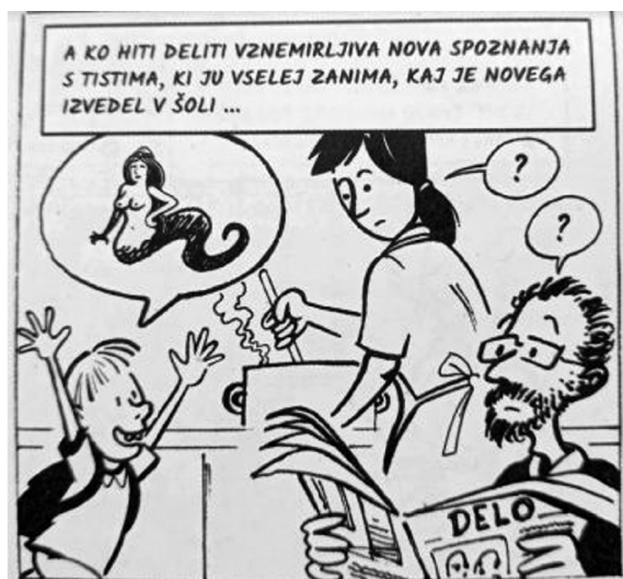
Slika 9: Vizualna oblika govora v stripu O čudežih Gašperja Rusa.

ponazarja, da je govorec naročil kavo ali čaj) ali pa gre za likovno upodobitev nečesa – na Sliki 9 tako v govornem oblaku vidimo pol žensko, pol kačo, bitje, o katerem pripoveduje govorec na sliki. O čem govori, dodatno pojasnjuje tudi besedilo v okvirčku na vrhu prizora. Podoba v govornem oblaku simbolizira celotno zgodbo, ki jo je govorec (in bralec) izvedel na prejšnjih straneh stripa.