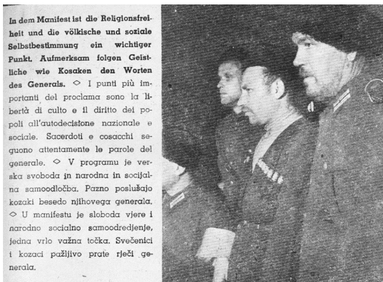
Slika 13: Propagandni članek o kozakih. Adratishes Illustrierte , 30. 12. 1944.

so jim na območju Kubana in Dona nameravali dati določeno avtonomijo, vendar sta vse načrte pokvarila poraz vermahta pred Stalingradom in sovjetska protiofenziva. 869 Nacistični poizkus lokalne samouprave ( Selbst-Verwaltung ) ni bil osredotočen izključno na kozake. Že jeseni 1941 je poveljnik 2. tankovske armade general Rudolf Schmidt upravljanje novozasedenega območja okrog mesta Lokot južno od Brjanska predal nekdanjemu sovjetskemu častniku Bronislavu Kaminskemu, ki je Republiki Lokot vladal do avgusta 1943. Podobna oblika vladanja je bila v enakem času vzpostavljena tudi v ukrajinskem Žitomirju, vendar je bila tam zaradi neznanega vzroka avtonomija predčasno preklicana. 870