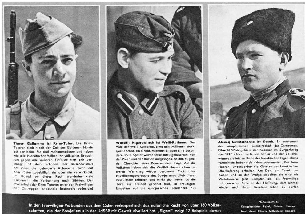
Slika 12: Nacistična propaganda predstavlja še tri primere sovjetskih kolaboaracionistov; Krimskega Tatar, Rutena, zadnji pa je Kozak. Signal, Heft OST, 1943.

katerega pripadniki so veljali za še posebej divje. Zaporožski kozaki, kot so postali znani, ker so živeli »za brzicami« Dnjepra, so se v 17. stoletju bojevali proti Osmanskemu imperiju. Po legendi naj bi jim sultan Mehmed IV. poslal ultimatum, kjer je zahteval, da se mu podredijo. Zaporožski kozaki pa naj bi mu, namesto da bi se ga ustrašili, poslali nazaj odgovor, v katerem so ga primerjali z najbolj nespodobnimi prispodobami, od Luciferjevega tajnika do sodomita. Originalnega pisma, poslanega sultanu niso nikoli našli, ohranila se je le domnevna kopija. Znani ruski slikar Ilja Repin pa je naslikal znamenito sliko Odgovor zaporožskih kozakov , ki prikazuje kozaško veselje in smeh ob sestavljanju pisma. Slika je v hipu postala hit in prodana je bila ruskemu carju Aleksandru II. za tedaj rekordnih 35.000 rubljev. Neukrotljiva narava in ponos kozakov, ki ju izžarevala slika, sta prevzela mnoge, med druge tudi Stalina, ki jo je postavil v svojo dačo v Kuncovem. Odgovor zaporožskih kozakov je postala najljubša slika kremeljskega voditelja. 831