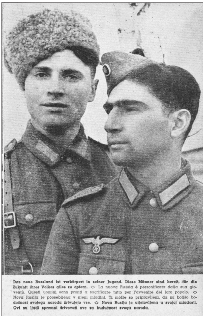
Slika 15: Del članka o Vlasovi vojski. Adriatisches Illustrierte , 30. 12. 1944.

boljševikov, ki so ga izpustili ob prisegi, da ne bo nasprotoval njihovi oblasti. Odšel je nazaj na donska območja, postal prvi predsednik republike donskih kozakov, razglasil Zvezno kozaško republiko (17. marca 1918) in postal eden vodilnih poveljnikov bele garde. Med državljansko vojno se je med drugim srečal z mladim angleškim častnikom Haroldom Alexandrom, poznejšim poveljnikom zavezniških enot v Italiji. 1051 Vrhovnemu atamanu in pisatelju so po prisilnem dogovoru z Domanovom ostali samo še osebna garda in tisoči kozakov, ki so v njem še vedno videli pretekli blišč kozaške tradicije.