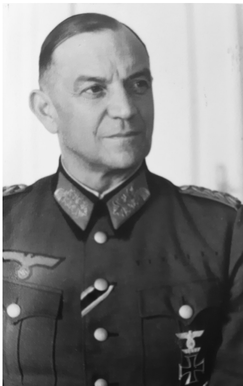
Slika 7: General Oskar von Niedermayer, poveljnik 162. turkeštanske divizije.

so znali nekaj nemščine, in še znanje teh tudi po prihodu iz prevajalske šole pogosto ni bilo na zadovoljivi ravni. 652 Skoraj nobeden od rekrutov v svojem življenju ni potoval iz svoje republike, če pa že, so bila njihova potovanja »večinoma primitivna«. Nikoli še niso videli »moderne civilizacije, kot so tovarne, nebotičniki, tramvaj ali moskovska podzemna železnica«. 653 To skromnost so Nemci videli tudi pri izobraženih legionarjih, kot je primer armenskega učitelja iz Erevana, ki je za prizadevno delo dobil brezplačno potovanje do Krasnodarja in Rostova. S tem, da so nacisti iskali rekrute, ki v življenju skoraj niso potovali, so želeli nanje narediti kar se da velik vtis, ko bi ti prišli v Nemčijo. 654 Še posebej so svojo propagando usmerjali v propagandiste in prevajalce, ki so v časopisu, namenjenem turkeštanskim prostovoljcem, rojake bodrili za borbo na strani nacistične Nemčije. 655