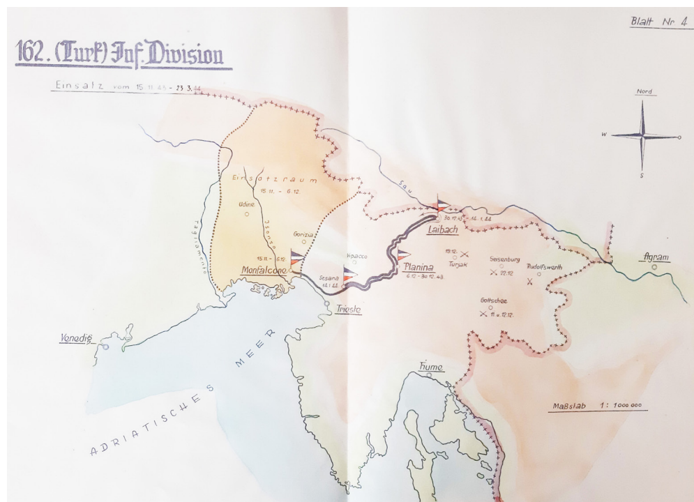
Slika 11: Delovanje 162. turkeštanske divizije pozimi 1943/1944.