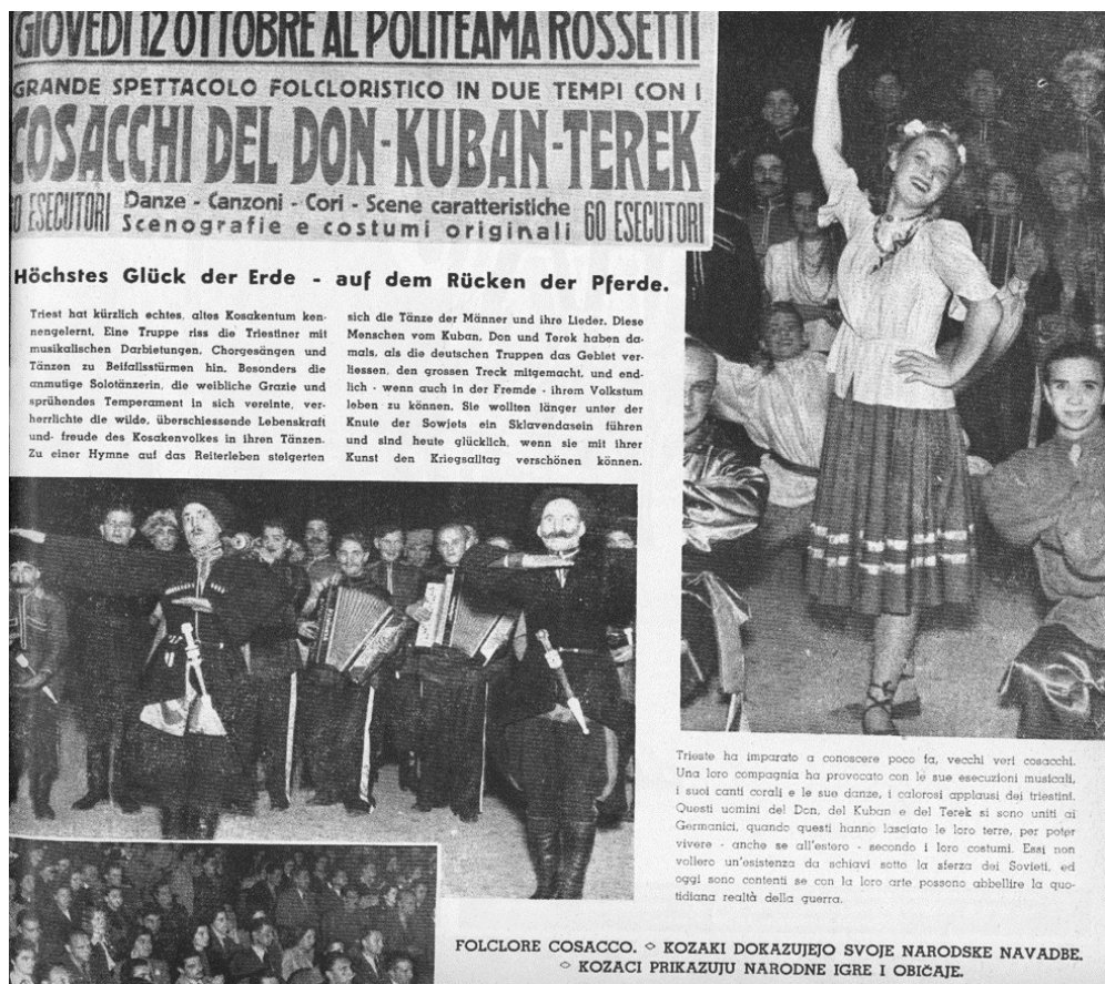
Slika 14: Kulturna predstavitev kozakov v tržaškem gledališču Rossetti. Adriatisches Illustrierte , 28. 10. 1944.

Čeprav so se kozaki pogosto zdeli necivilizirani, jim je umetnost veliko pomenila. Skupaj z njimi so prišli tudi umetniki. Izvajali so nastope za druge kozake, prirejali pa so tudi posebne predstave za lokalno prebivalstvo, kot je bil nastop v prestižnem tržaškem gledališču Politeama Rossetti. Ta dogodek je izkoristil propagandni tednik Adriatisches Illustrierte , ki je kozake predstavil kot borce proti sovjetskemu suženjstvu. 1034 Nekaj dni po tržaškem nastopu so umetniki nastopili še v videmskem gledališču Puccini in časopis Il Popolo di Friuli je pisal, da naj bi bila predstava tak uspeh, da so jo morali naslednjo nedeljo ponoviti. 1035 V teh nastopih sta se s petjem, plesom in skeči predstavljali kozaška folklor in njihova preteklost. V središču kozaškega Stana, Tolmeču, je nastalo gledališče