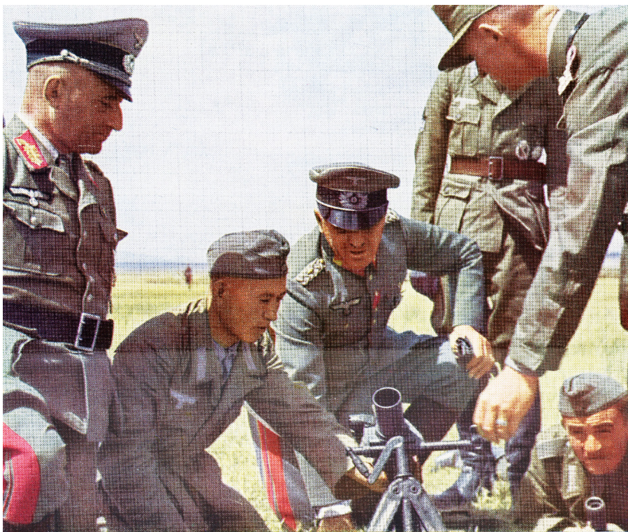
Unter den Augen des Generals. Der General der Osttruppen überzeugt sich persönlich vom Ausbildungsstand seiner Legionäre und läßt sich von turkestanischen Freiwilligen erklären, wie man einen Granatwerfer handhabt.

Poveljniku 162. turkeštanski divizije, generalu Oskarju von Niedermayerju, je bilo dano šest mesecev časa, 743 da usposobi svoje vojake, kar je pomenilo od junija do konca novembra 1943. Tako dolg čas je bil dodeljen predvsem zato, da bi se prostovoljci privadili nemškemu načinu vodenja enote in oborožitvi. Turkeštanci, ki so jih Sovjeti vzeli iz njihovih vasi in jih brez kakršnegakoli urjenja poslali na frontno linijo, pogosto niso imeli nobene izkušnje z nemškim orožjem. Ko so se urili, kako vreči ročno bombo, da ta eksplodira v zraku, jih je bilo strah, saj jih večina še nikoli ni uporabljala granat. 744 Učili so se uporabe mitraljezov, topništva, natančnega streljanja in vseh vrlin, potrebnih za pohode proti partizanom. Idilo urjenja pa je začelo oteževati dejstvo, da so Sovjeti na vzhodni fronti vedno bolj pritiskali na vermaht, zato je bila enota v velikosti divizije iz dneva v dan bolj nepogrešljiva. 745 Iluzije o temeljitem in dolgem urjenju Turkestancev je bilo že po treh mesecih konec.