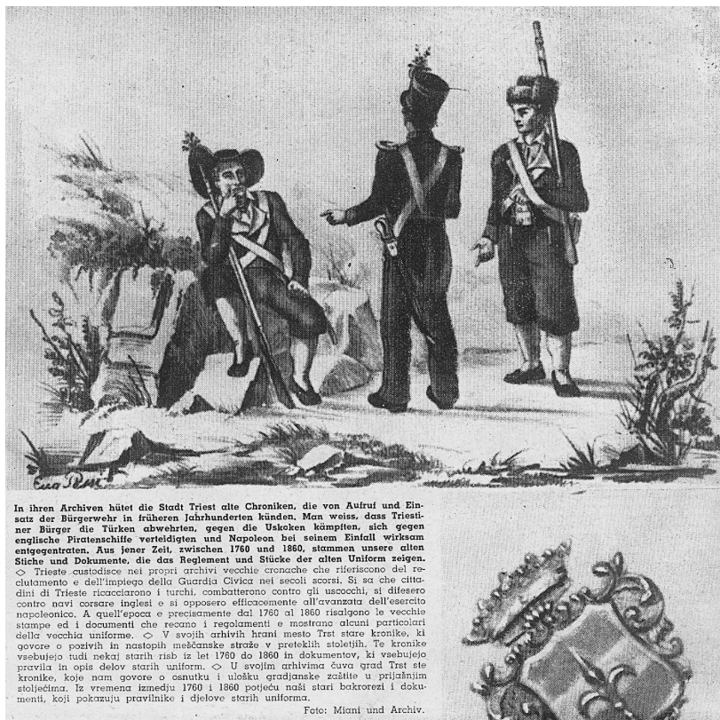
Slika 3: Propagandno navezovanje na služenje vojske Tržačanov v času avstrijske nadvlade. Enote so se imenovala Guardia civile in ne Guardia nazionale repubblicana kot v preostali RSI. Adriatisches Illustrierte , 10. 3. 1945.