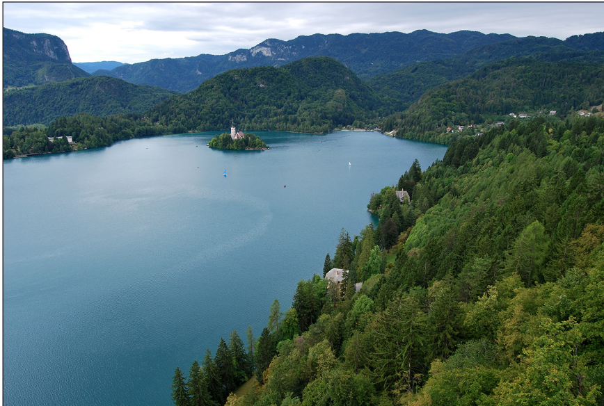
Slika 9.2: Bled je že v drugi polovici 19. stoletja postal eden najbolj obiskanih turističnih krajev v Sloveniji.

Zlasti po drugi svetovni vojni so na Bledu postali zelo pomembni vplivi industrializacije, tako da so vplivi turizma na kmetijstvo stopili nekoliko v ozadje, čeprav nikakor niso izginili. Rezultat teh različnih vplivov je bil opazen že v fiziognomiji samega naselja (Jeršič, 1967a; 1967b). Prisotni so bili tudi sezonski vplivi na delovno silo, ki jo je Bled v poletnem času izrazito privlačil (Jeršič, 1967b; 1970).