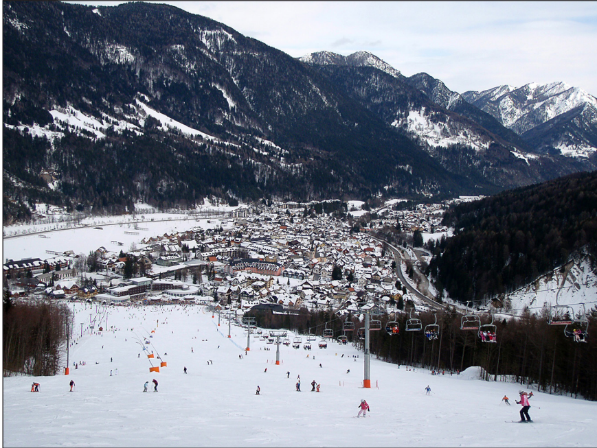
Slika 9.3: Kranjska Gora je najbolj prepoznaven slovenski zimskošportni turistični kraj.