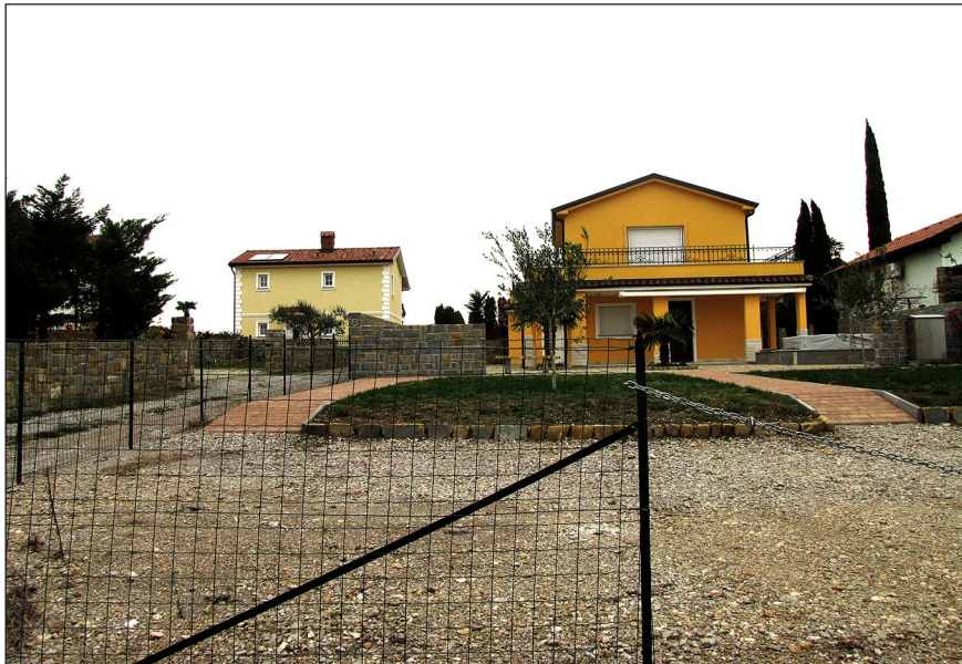
Slika 9.4: Počitniško bivališče na območju Izole.

V več delih se je ustavil pri raznovrstnih učinkih, povezanih s prisotnostjo počitniških bivališč (npr. Jeršič 1998). Ti učinki so bili po njegovih ugotovitvah problematični v vseh predelih splošnega družbenega pomena, kot so npr. ekološko pomembni biotopi, območja, ki so posebej privlačna za rekreacijo na prostem, območja posebnega znanstvenega, estetskega, poučno-vzgojnega in kulturnega pomena, območja primerna za sodobno kmetijsko proizvodnjo ipd. Problematični učinki se lahko pojavijo šele v določeni fazi njihovega razvoja. Posamezni majhni zaselki ne motijo, toda z njihovo širitvijo in transformacijo v stalna naselja pride do vedno močnejših obremenitev okolja. Z inštrumentarijem prostorskega planiranja je možno obremenitve okolja preprečevati, zlasti pa usmerjati tovrstno gradnjo le na bolj primerna območja (Jeršič, 1987b). Še najbolj očiten je bil vpliv sekundarnih počitniških bivališč na preoblikovanje posameznih vinorodnih pokrajin, kjer je zaradi deagrarizacije po drugi svetovni vojni prišlo do opuščanja vinogradniške rabe. Nenačrtna gradnja teh objektov je na vinorodnih območjih, predvsem zaradi gostote in postavljanja neprimernih gradbenih struktur na izpostavljenih legah (slemenih), marsikje razvrednotila dotedanji pokrajinski videz (Jeršič, 1998).