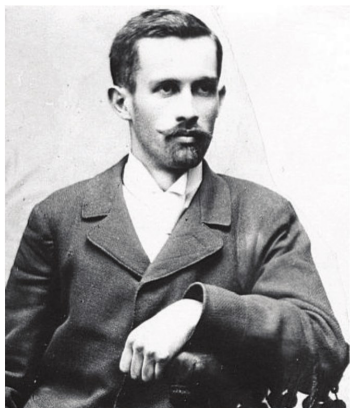
Slika 1: Jovan Skerlić.

V 40 letih izhajanja (1901–1914; 1920–1941) je bil Srpski knjiž evni glasnik eden vodilnih literarnih časopisov v Srbiji. Največ zaslug za nastanek časopisa imajo prvi uredniki Bogdan in Pavle Popović (1868–1939) ter Jovan Skerlić (1877–1914), ki so v njem aktivno sodelovali. Skerliću je uspelo zbrati veliko število mladih pisateljev izven Srbije in reviji dati južnoslovanski značaj.