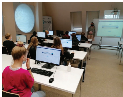
Slika 2. Iskanje po Cobissu.