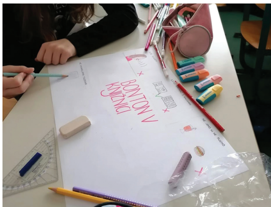
Slika 3. Ustvarjanje plakatov.