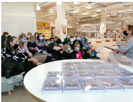
Slika 1. Obisk v Cankarjevi knjižnici.

Na Osnovni šoli Antona Martina Slomška Vrhnika vsako leto sodelujemo v projektu Rastem s knjigo. V ta namen organiziramo kulturni dan. Z učenci obiščemo Cankarjevo knjižnico Vrhnika, kjer nam predstavijo splošno knjižnico (Slika 1), projekt Rastem s knjigo in vsak učenec dobi svoj izvod mladinske literature. V drugem delu spoznavamo osnove iskanja po Cobissu (Slika 2) in učenci v skupinah ustvarjajo plakate na temo bontona v knjižnici (Slika 3), pri čemer jim ne omejujemo izvirnosti, vsaka skupina lahko plakat oblikuje poljubno (miselni vzorec, piktogrami, strip, zgodba ipd.).