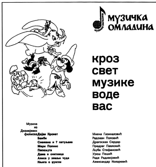
Slika 1. Programска knjižica за концерт „Музика из Дизнијевих филмова”.