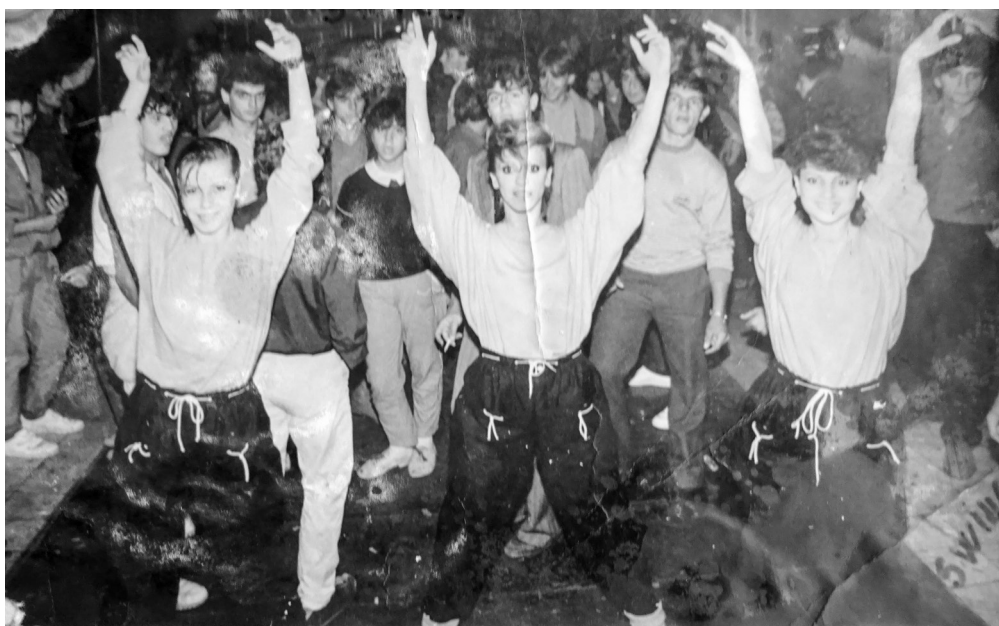
Slike 6 i 7. Grupa „SWING”.