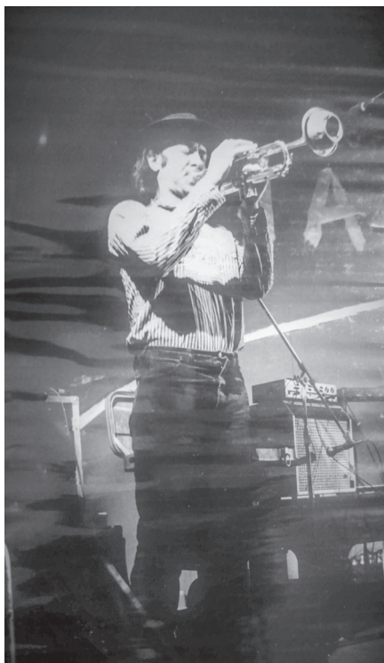
Slika 4. Džez nastup, iz albuma MOM-a.

70-ih, i to projekcijama filmova s temama o džez muzici 61 i drugim popularnim žanrovima, kao i organizovanjem tematskih predavanja. 62