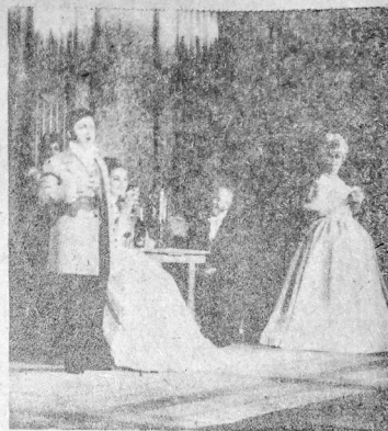
ДА СЕ ЗАСАКА И СЕРИОЗНАТА МУЗИКА: СЦЕНА ОД ЕДНА ОПЕРСКА ПРЕТСТАВА

Факт е дека ние немаме голема традиција во посетноста на театарските и оперските претстави. Ова, уште позабележително е на концертите од областа на сериозната музика. Би-