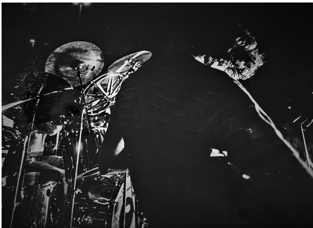
Slika 5. Džez nastup, iz albuma MOM-a.

MNT-a početkom 90-ih, uočićemo predstave u kojima dominiraju novi stilovi savremene igre. U radu MOM-a ova je vrsta plesa prisutna na programima znatno ranije. Izdvojili bismo sledeće grupe: „Avona”, „Venera”, „Andromeda” i „SWING”. One su bile deo najrazličitijih vrsta manifestacija, od nastupa u kassarni Maršal Tito, preko tematskih večeri (džez, disko, rok muzika), do proslave Dana mladosti (od 1979. do 1990). Gotovo je jednak bio broj nastupa folklornih plesnih grupa, uz napomenu da su prednjačili amaterski ansambli.