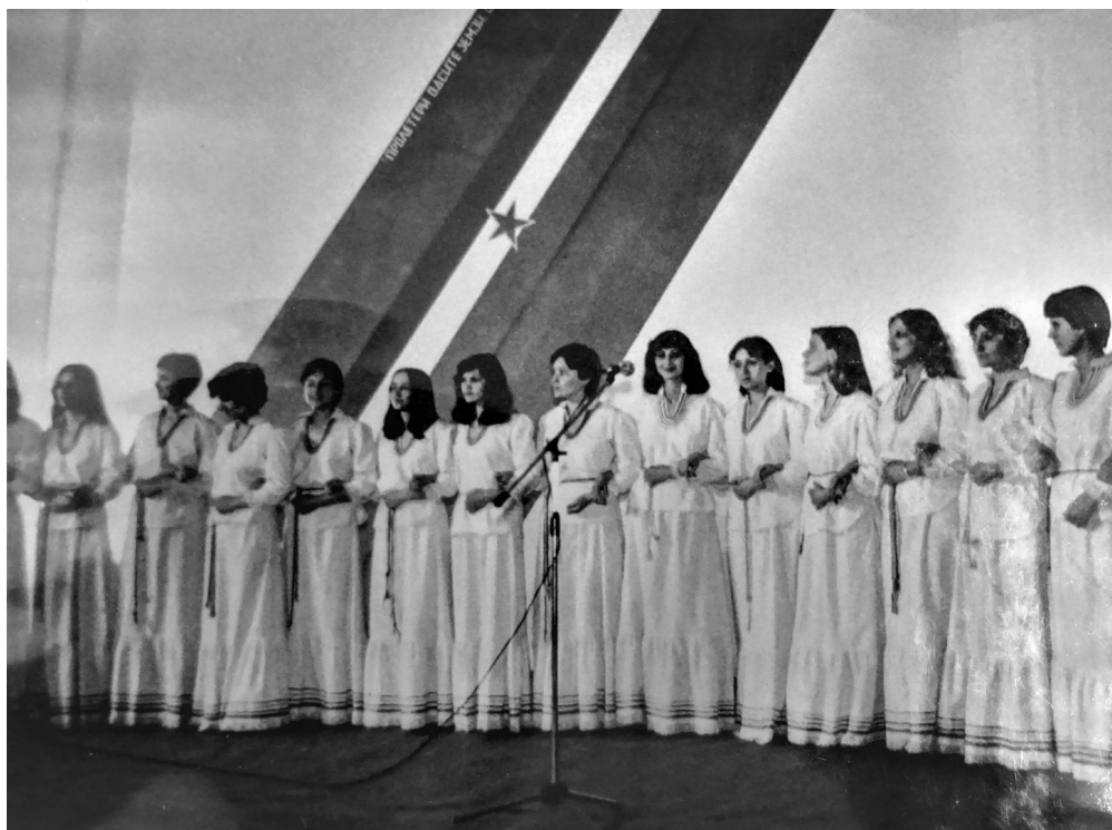
Slika 3. Proslava Dana mladosti u organizaciji MOM-a i Doma omladine „25. maj” u Skoplju (aktuelni Omladinski kulturni centar, MKC).

U duhu širih društvenih promena, MOM je 1974. godine usvojio i novi Statut. Osnovni zadatak organizacije definisan je na sledeći način: „probuditi, razviti i usmeriti ljubav prema muzici, drugim umetnostima i kulturi, nastojeći da mladim ljudima omogući što više susreta s umetničkim delima i umetnicima”. 51 Pored toga, primetna je i želja za uključivanjem mladih „bez obzira na sredinu u kojoj žive, da što bolje upoznaju nacionalno stvaralaštvo i kulturna dostignuća svih naroda i narodnosti Jugoslavije”. 52 Statut MOM-a predviđao je učešće delegata iz svih gradskih organizacija u procesu donošenja odluka u skladu s principima samoupravljanja. Međutim, u praksi, posebno kada se sprovodio izbor delegata u savezne organe, kao i za međunarodne događaje, fokus je i dalje bio na velikim urbanim sredinama, pretežno na Skoplju i tamošnjim kadrovima.