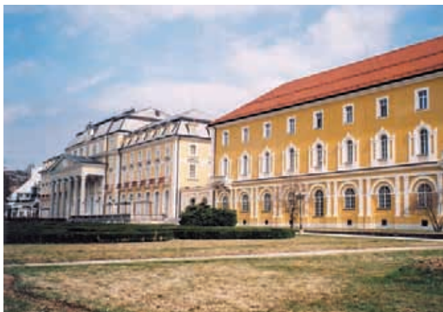
Slika 90: Rogaška Slatina je bila prvi slovenski turistični kraj, ki si je pridobil mednarodno veljavo.

Po mnenju anketiranih turistov izstopa po pomenu (velikosti) vplivov le prometno obremenjevanje oziroma parkiranje v naravi, drugi vplivi pa so po svojem pomenu že precej v ozadju. Še zlasti to velja za erozijo/poškodbe sprehajalnih, pohodniških in drugih poti, uničevanje rastlinstva in motenje divjih živali ter škodo zaradi hoje po kmetijskih zemljiščih (travniki, njive). Turisti torej v splošnem v primerjavi z domačini ocenjujejo okoljske vplive turizma in rekreacije na okolico turističnih krajev kot manjše. Takšni odgovori so nedvomno povezani s tem, da je delež turistov, ki preživljajo svoj prosti čas tudi v zaledju obmorskih turističnih krajev, razmeroma skromen, kar ne pomeni samo manjših vplivov, ampak tudi njihovo slabše zaznavanje.