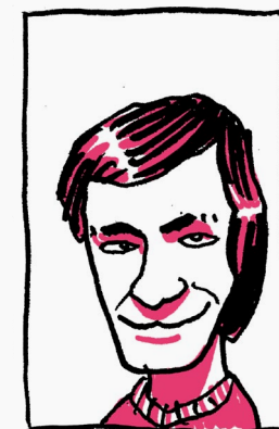
3. Grupa Junij

LIT.: D. MEDVED, Mednarodna likovna zbirka Junij , Celjski zbornik, 20, 1985, 330–336; Grupa Junij: prisotnost metafizike (ur. S. JAGODIČ), Lj 1980, kat. (več razstavišč); S. JAGODIČ, Grupa Junij , v: S. Jagodič, Orbis Artis - Nemirno in kreativno , Šmarje pri Jelšah 2006, 474–601).