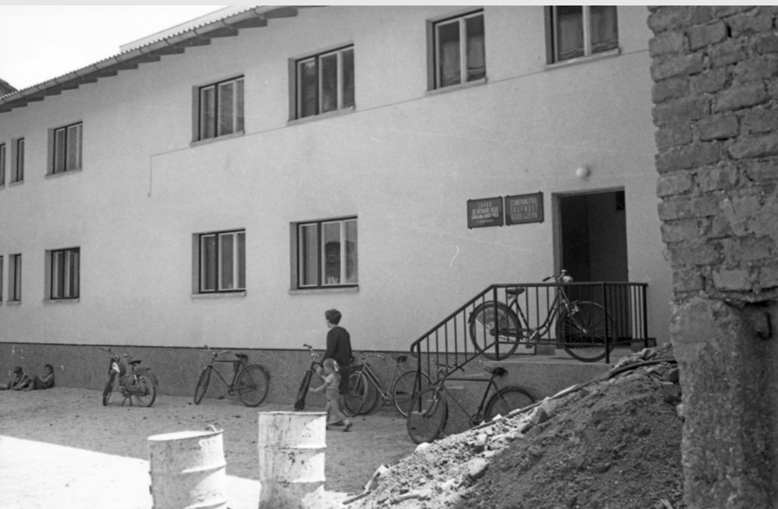
Dom za socialne delavce v Mostah. Ljubljana, junij 1962. inv. št.: DE1161/11.