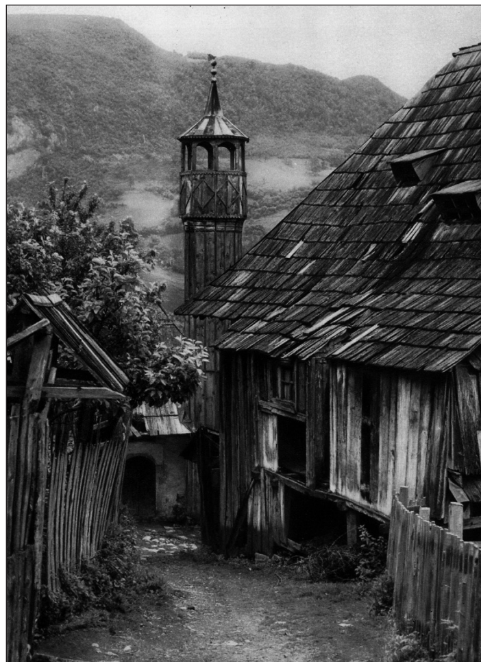
Slika 6. Siromašno predgrađe Jajca sa drvenim kućama pokrivenim šindlom i drveni minaret (Hielscher 1926, 117).

skih dobara i razvijene poljoprivrede Bosna, posebice Bosanska krajina vijekovima bila je prepuna vodenica – malih i većih mlinova za brašno koji su u velikom broju prelazili tokove rijeka Une, Vrbasa i Sane ili bili izgrađeni na strmoj obali manjih potoka. Zbog brojne pojave ma-