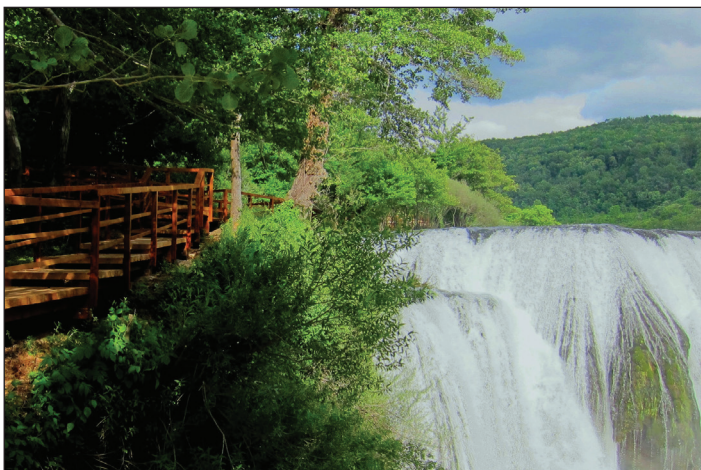
Slika 2. Štrbački buk na Uni, park prirode i vodopada.