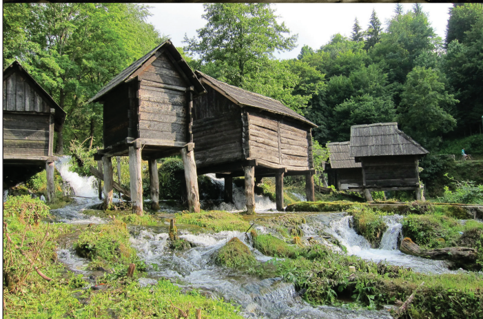
Slika 7. Plivsko jezero kod Jajca. »Bosanski« mlinovi kašikare - s vodoravnom turbinom na vertikalnoj osi (Hielscher 1926, 109).