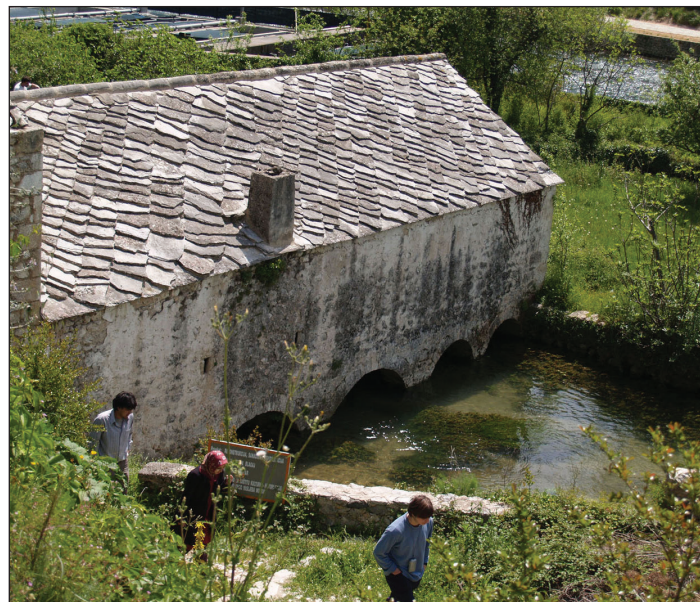
Slika 9. Kameni mlin u Blagaju (foto R. Dodig 2013).

Ako su na početku fotografije bile pre svega dokumentacija i stvar određenog publiciteta i identiteta (razglednice), danas su te iste fotografije, a uz njih tokom vremena i mnoge nove snimane specializirano za turističke, propagandne, tehničke, infrastrukturne, strateške i naučne svrhe, dragocjen izvor za cjelokupnu, interdisciplinarnu interpretaciju životne okoline.