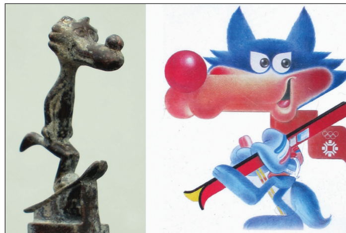
Slika 3. Vučko, mala metalna skulptura iz olimpijske godine Sarajevo 1984 i savremena edicija sa magnetom na današnjem tržištu suvenira.

Uz mnoge društvene, privredne i sportske ambicije cjelokupne zajednice za vreme dugogodišnjih ugovaranja realizacije u okviru olimpijskih foruma trebalo je pripremiti terene i saradnike te ujedno izabrati i simbol te velike sportske manifestacije. Maskota sarajevske Olimpijade izabrana je pomoću brojnih čitaoca jugoslovenskih novina, koji su birali između likova gamsa, lisice, dikobraza, vjeverice, janjeta i pahulje te izabrali Jahorinka, danas poznatog Vučka, kojeg je nacrtao poznati karikaturist Jože Trobec iz Kranja.