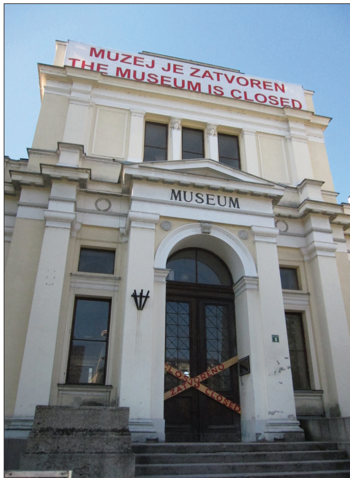
Slika 5. Zemaljski muzej Bosne i Hercegovine, 2013 – 2014. godine (, 15. 05. 2013).

skih dobara i razvijene poljoprivrede Bosna, posebice Bosanska krajina vijekovima bila je prepuna vodenica – malih i većih mlinova za brašno koji su u velikom broju prelazili tokove rijeka Une, Vrbasa i Sane ili bili izgrađeni na strmoj obali manjih potoka. Zbog brojne pojave ma-