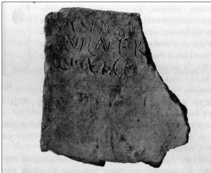
Sl. 4.K. Patsch, Rimski nalazišta u Kotaru Novljanskom. GZM, X/1898, 496.

(Čremošnik 1965, 166). Zanimljiva je jedan krovni crijep sa otvorom koji je vjerovatno služio za svjetlo. U Višićima je pronađen i veliki broj uvezene cigle i crijepa: PANSIANA, COELI, MAXENTIA, T. R. D., M. VAL. DOR. i dr. U Mogorjelu su otkriveni ostaci uvozne cigle i crijepa sa pečatima: SOLONAS, Q (vinti) S(lodius) AMBROSI, NER (onis), CLAVD (i) P(ansiana) (Škegro 1991, 67, 69). U Domaviji je u istočnom dijelu kurije nađeno ostataka imbreksa i cigle. U kupatilu je također nađeno dosta imbreksa i ciglastog beton. U termama u Blagaju na Japri, za izradu poda pronađena je heksagonalna podna cigla visoka 4,5 cm, ali i zidna cigla i crijep u cijelom kompleksu (Basler 1977, 163). Komad čitavog imbreksa pronađen je u Pijavcima kod Jajca, na mjestu nekadašnje rimske ciglane. Njegove dimenzije su: 45 cm dug, širok 38, a debeo 3 cm (Radimsky 1895, 218).