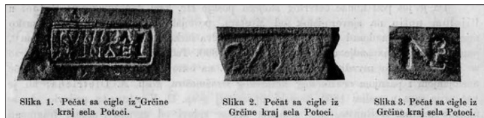
Sl. 1. K. Patch, Arheološko-epigrafska istraživanja o povijesti rimske provincije Dalmacije , GZM 16, 1904, 34.

Vojničkih radionica bilo je više jer su ih legije trebale za gradnju svojih logora i za granične potrebe. Za gradnju logora u Hercegovini dovožena je cigla iz Smrdelja (kod Knina) gdje su se nalazile bogate naslage gline. Ovu glinu koristile su vojničke radionice u Smrdeljima, a potom